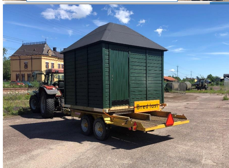
Radarhyddan har anlänt till museet.