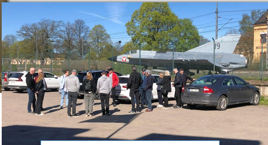
Besök från Rytterne Soldatförening, Västerås.