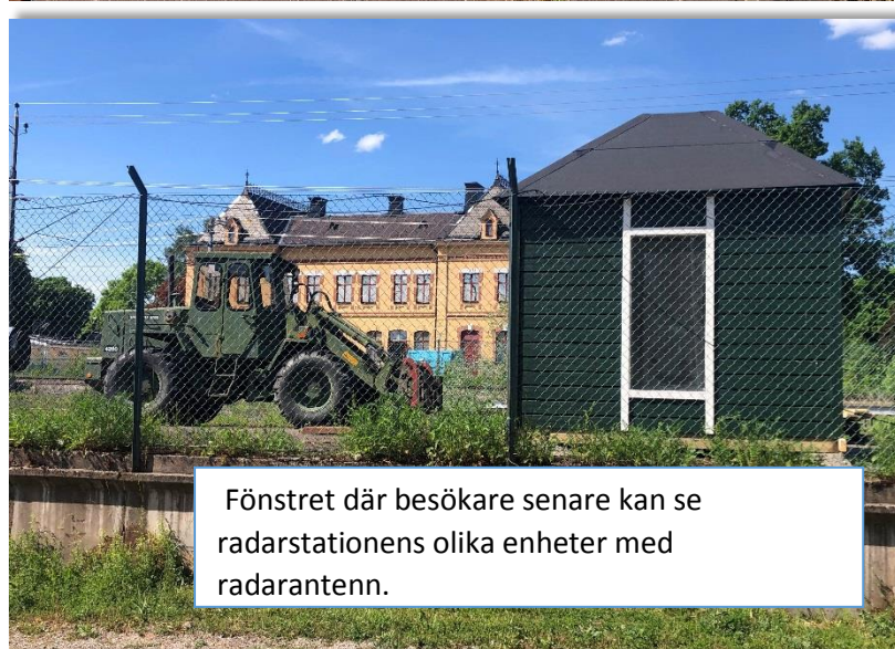
Fönstret där besökare senare kan se radarstationens olika enheter med radarantenn.