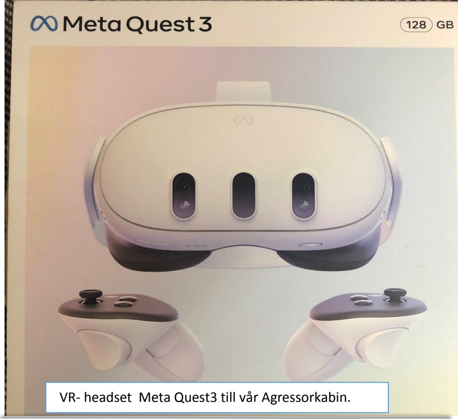
VR- headset Meta Quest3 till vår Agressorkabin.