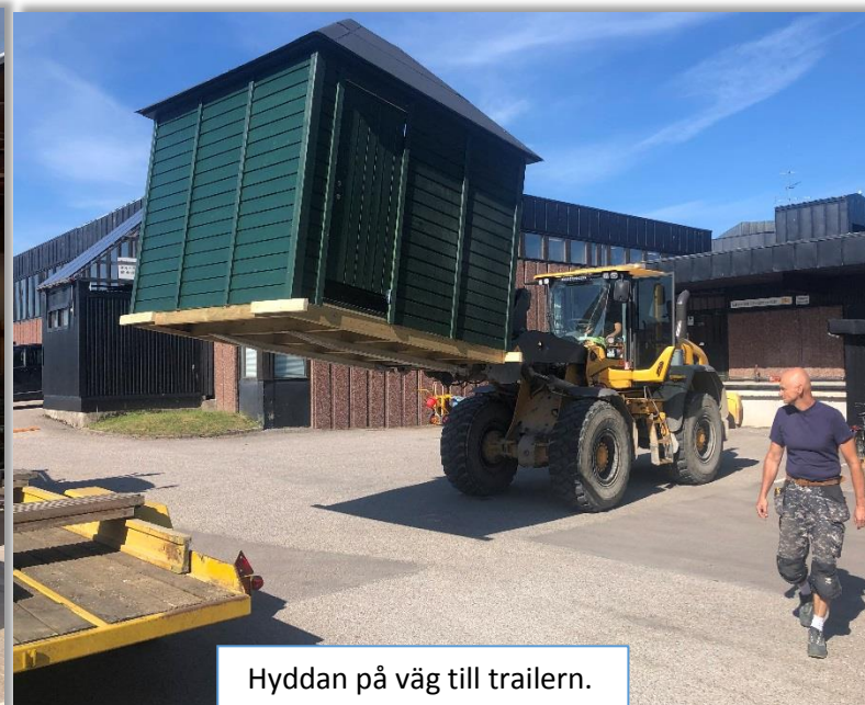
Hyddan på väg till trailern.