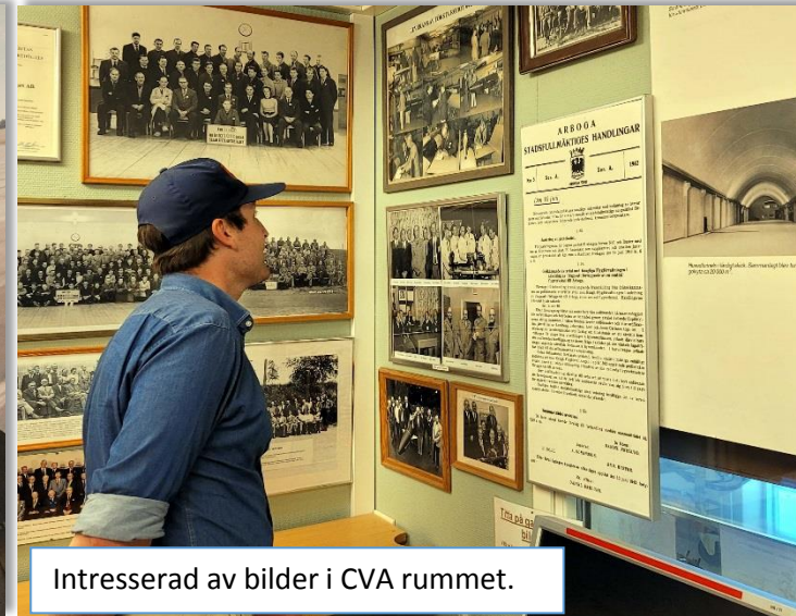
Intresserad av bilder i CVA rummet.