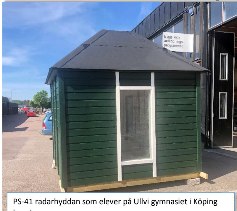
PS-41 radarhyddan som elever på Ullvi gymnasiet i Köping byggt