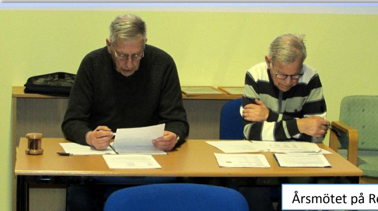
Årsmötet på Robotmuseet.