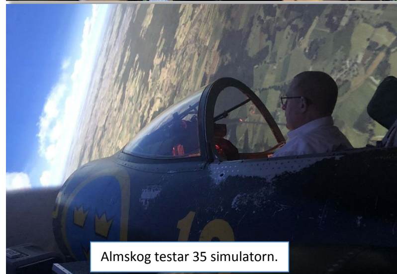
Almskog testar 35 simulatore.