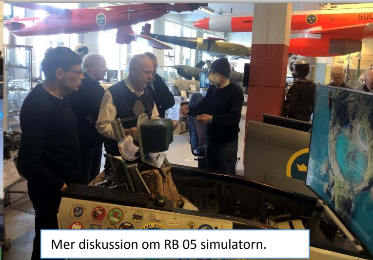
Mer diskussion om RB 05 simulatore.