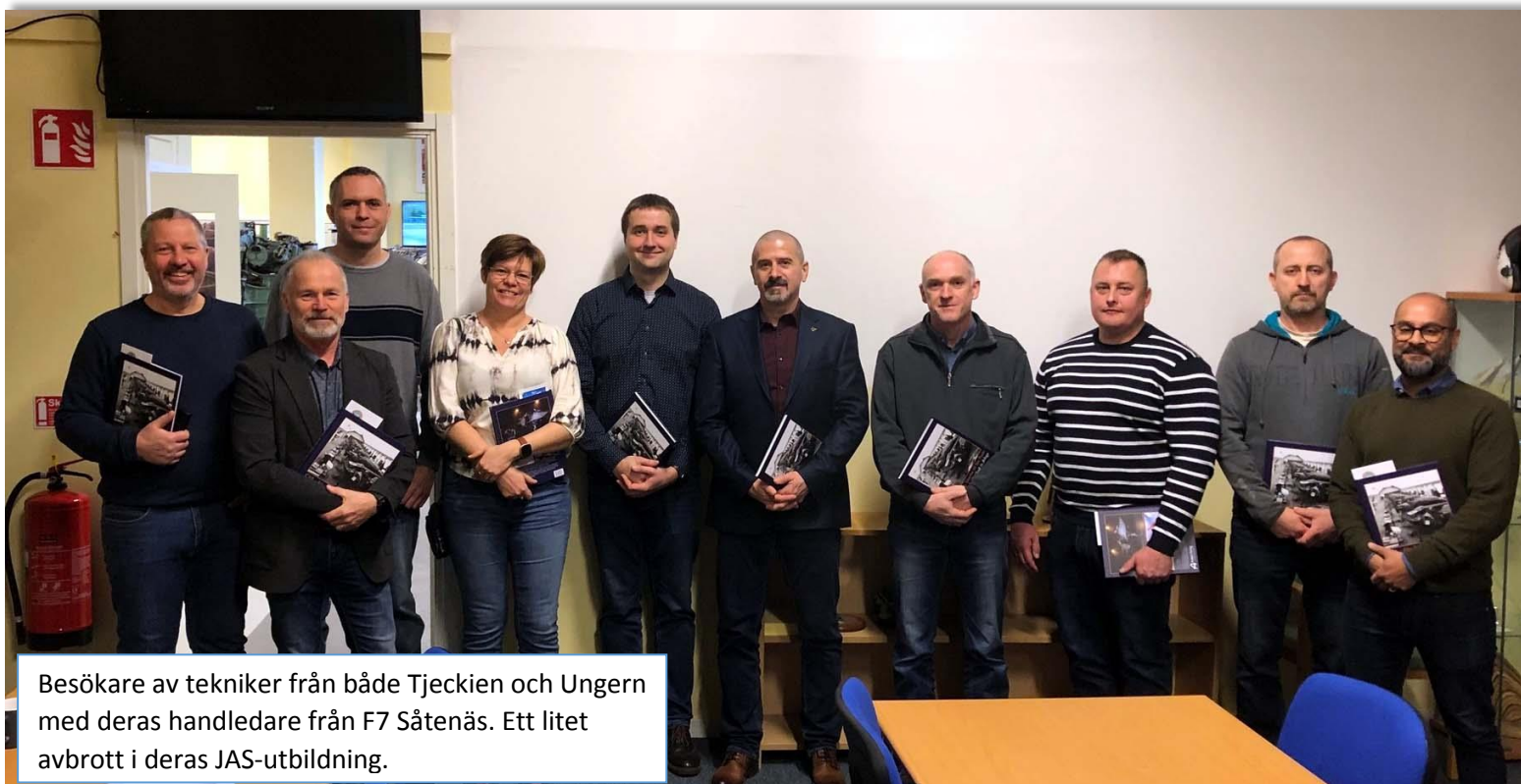
Besökare av tekniker från både Tjeckien och Ungern med deras handledare från F7 Såtenäs. Ett litet avbrott i deras JAS-utbildning.