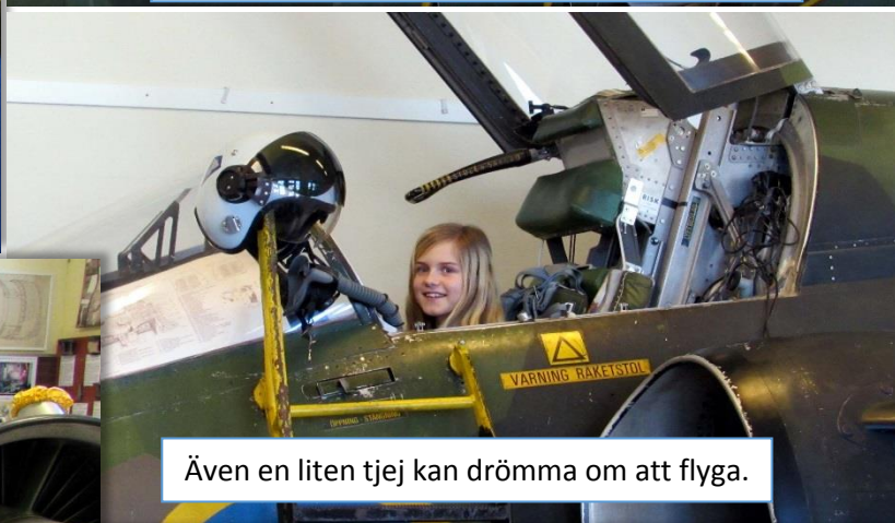
Även en liten tjej kan drömma om att flyga.