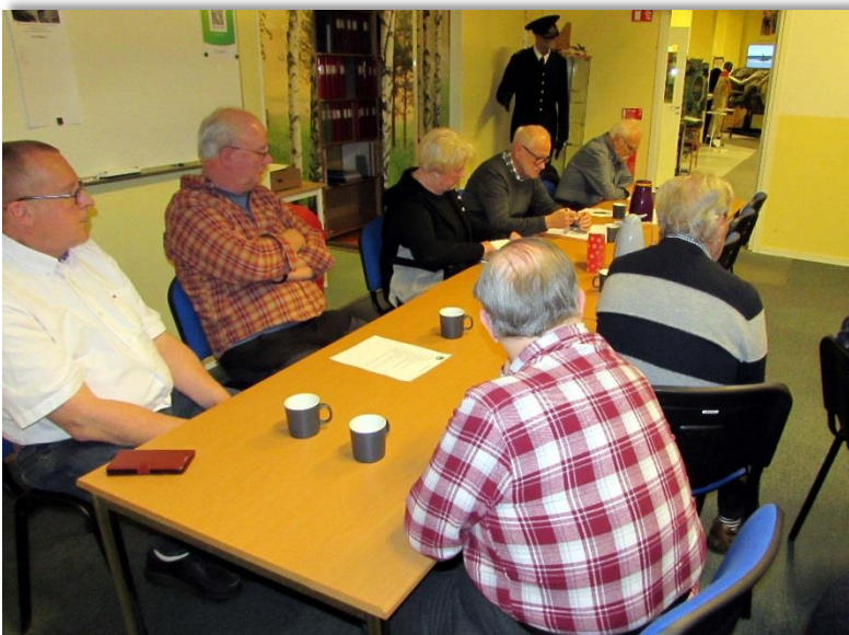
Några av våra medlemmar.