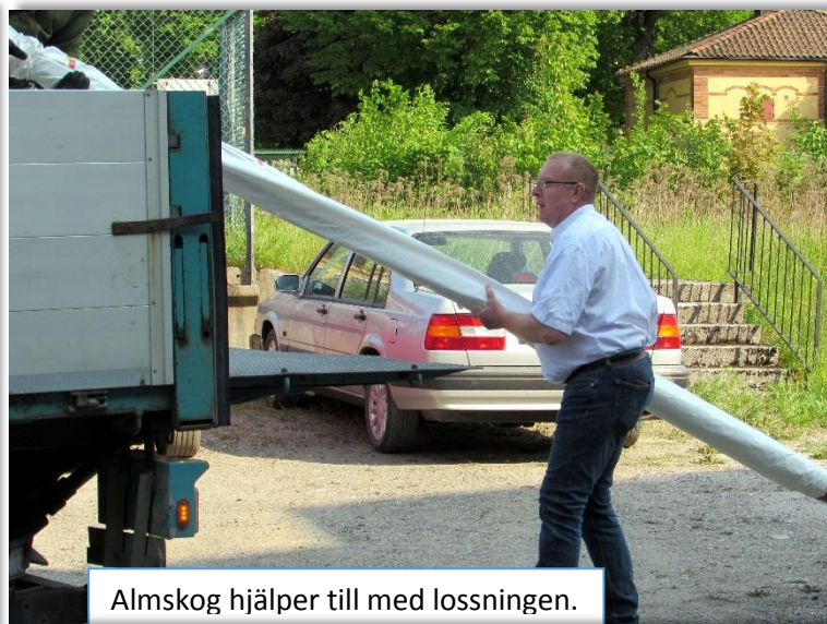
Almskog hjälper till med lossningen.