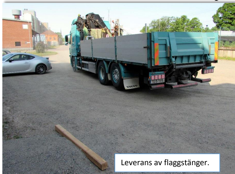
Leverans av flaggstänger.