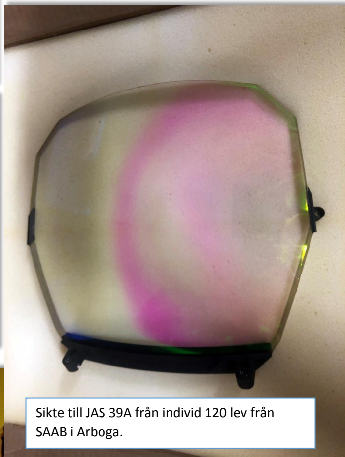
Sikte till JAS 39A från individ 120 lev från SAAB i Arboga.