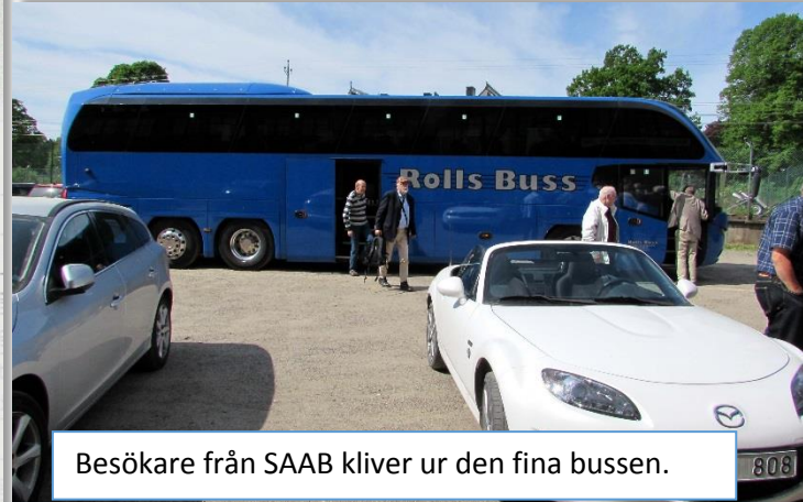
Besökare från SAAB kliver ur den fina bussen.