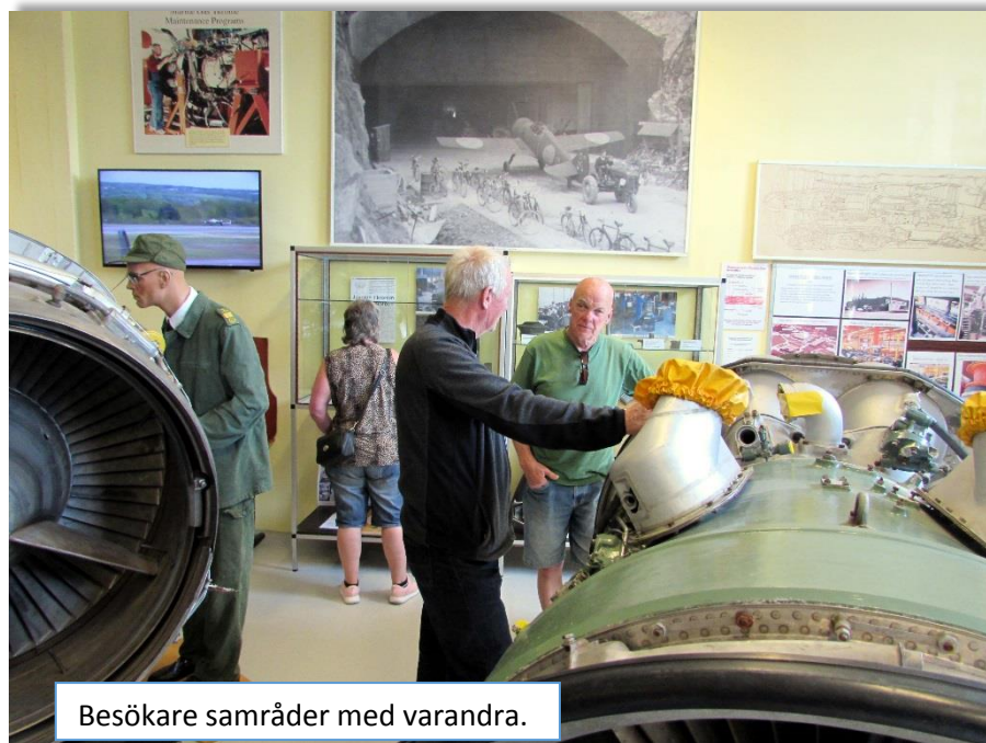
Besökare samråder med varandra.