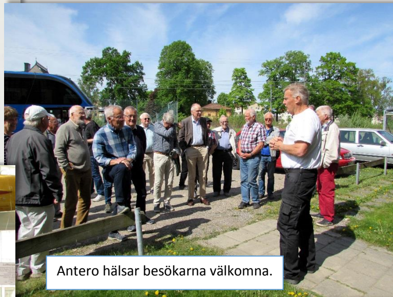
Antero hälsar besökarna välkomna.