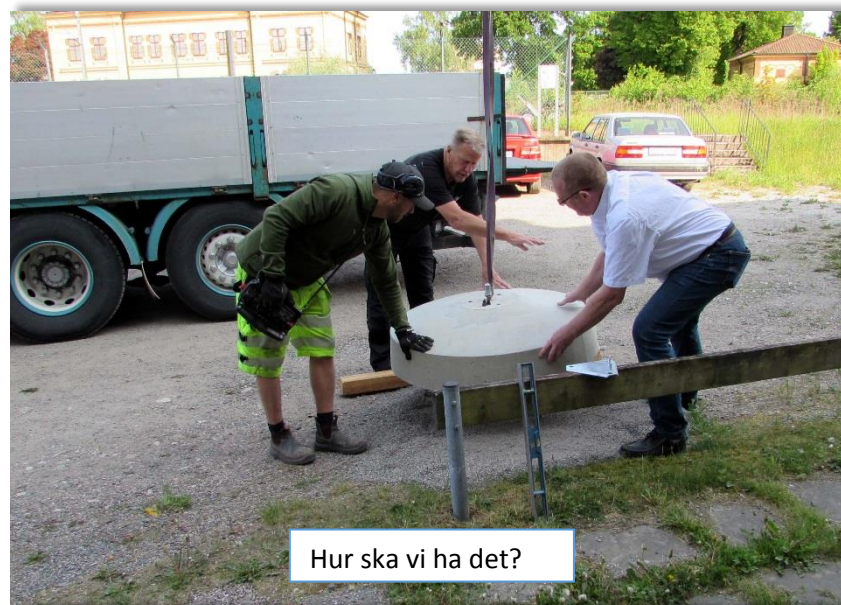
Hur ska vi ha det?