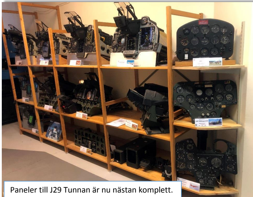
Paneler till J29 Tunnan är nu nästan komplett.