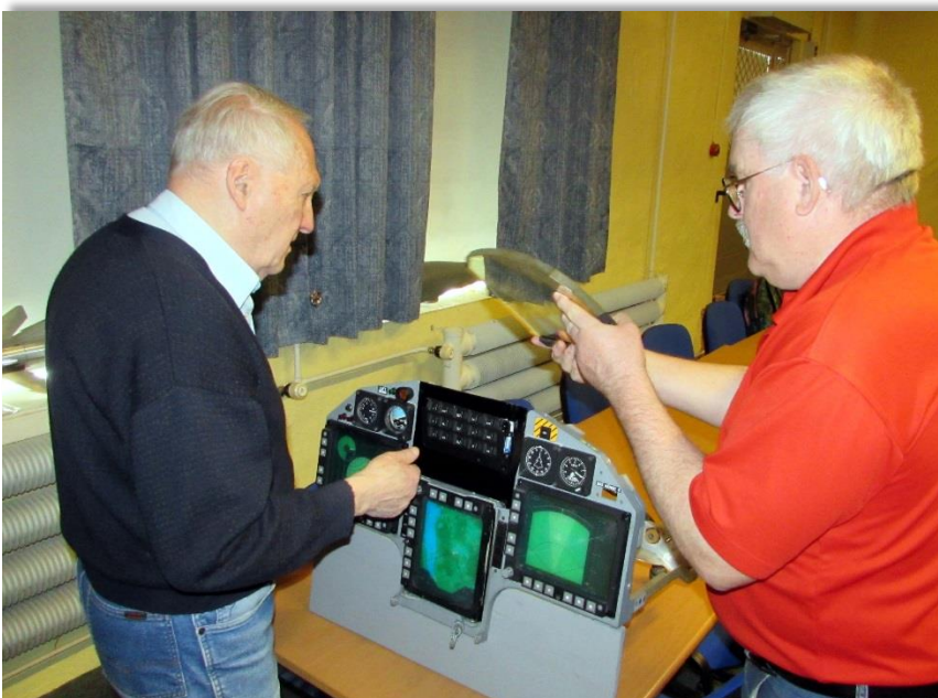
Pelle o Olle provar att montera siktet till JAS på en panel.