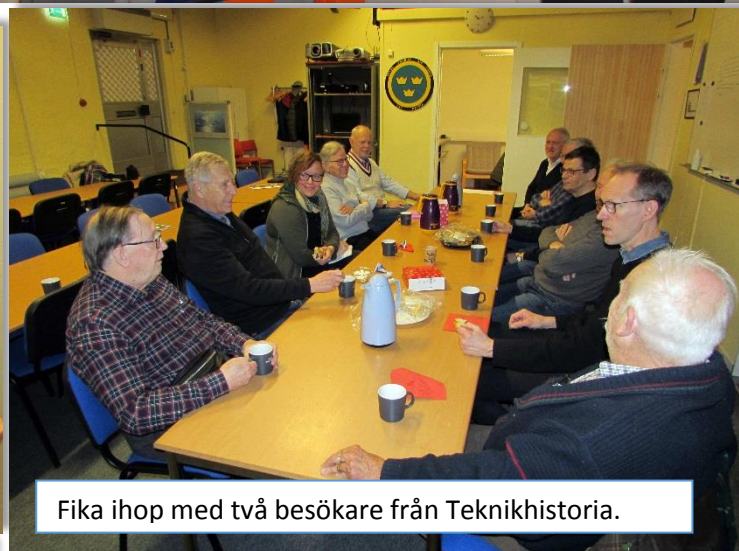
Fika ihop med två besökare från Teknikhistoria.