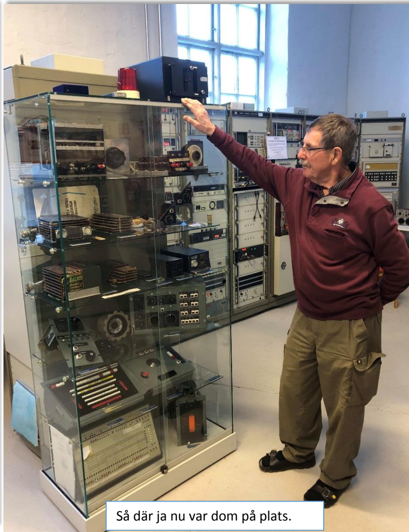
Så där ja nu var dom på plats.