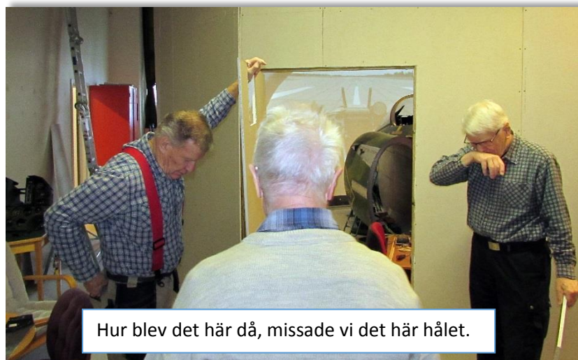
Hur blev det här då, missade vi det här hålet.