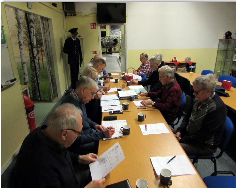
Första styrelsemötet på museet i januari 2023.