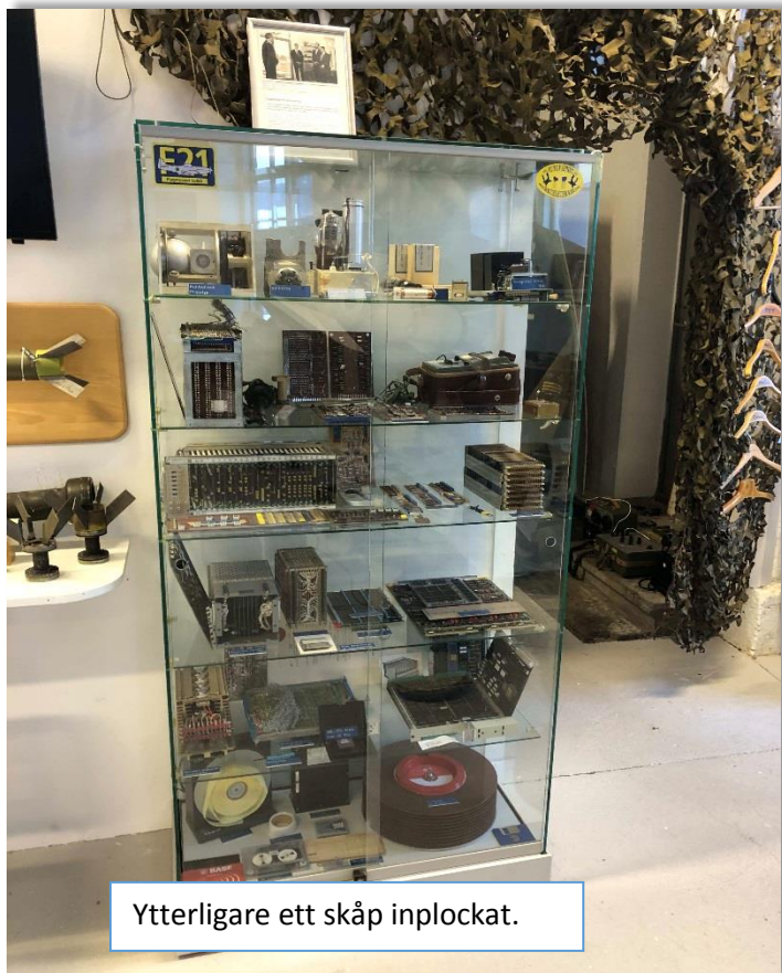
Ytterligare ett skåp inplockat.