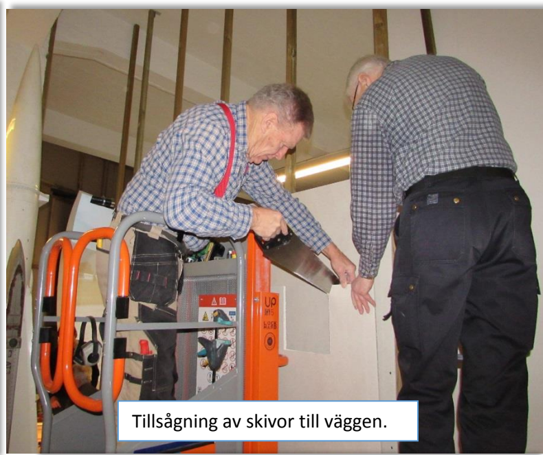
Tillsågning av skivor till väggen.