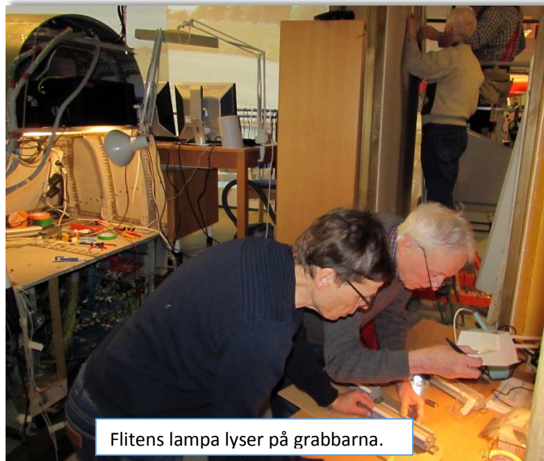
Flitens lampa lyser på grabbarna.