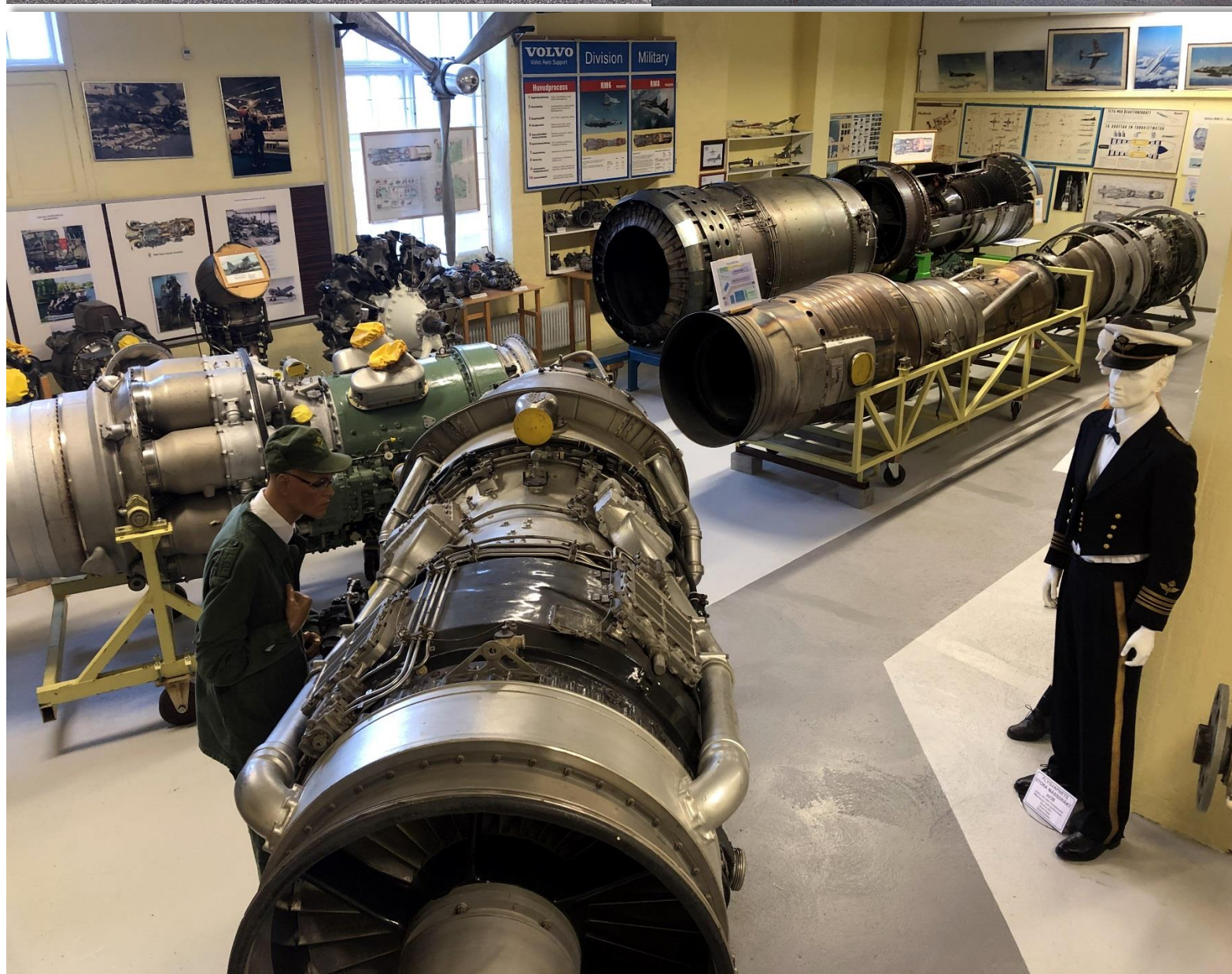
En bild på några motorer i vår samling. Översyn på RM10 pågår som vi ser.