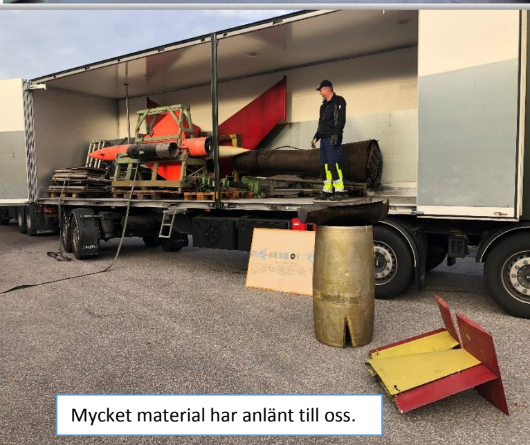
Mycket material har anlänt till oss.