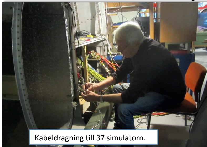
Kabeldragning till 37 simulatorm.