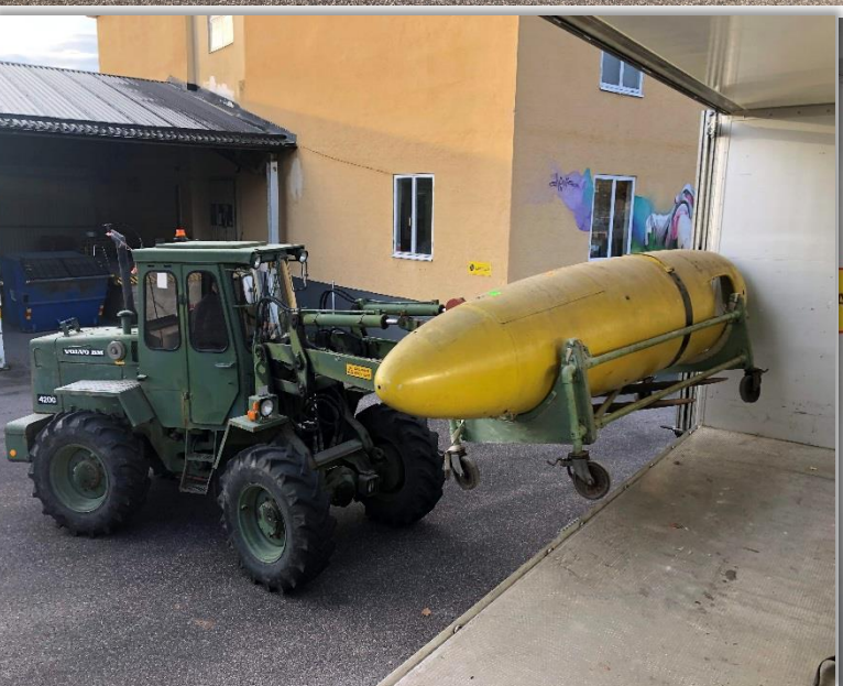
Ännu mer material.