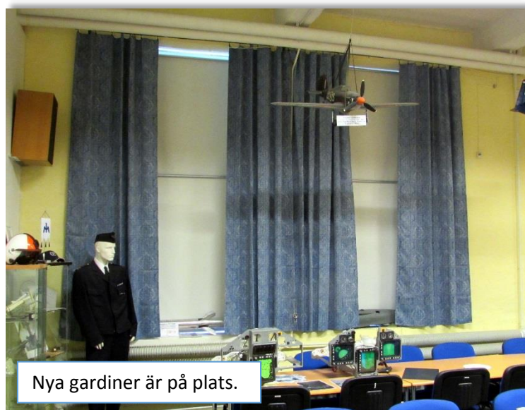
Nya gardiner är på plats.