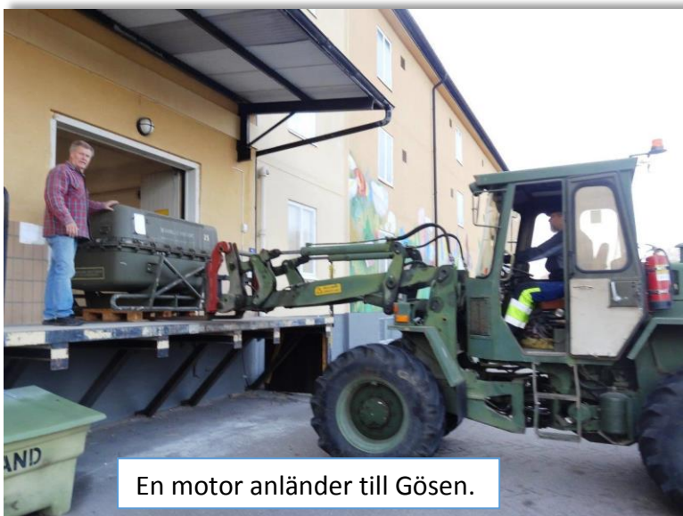
En motor anländer till Gösen.