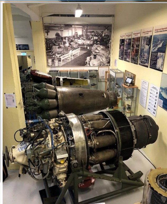
Några motorer och bild från berget i bakgrunden.