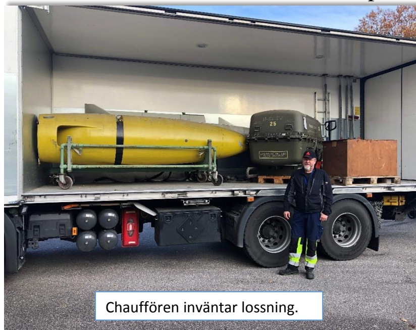
Chauffören inväntar lossning.