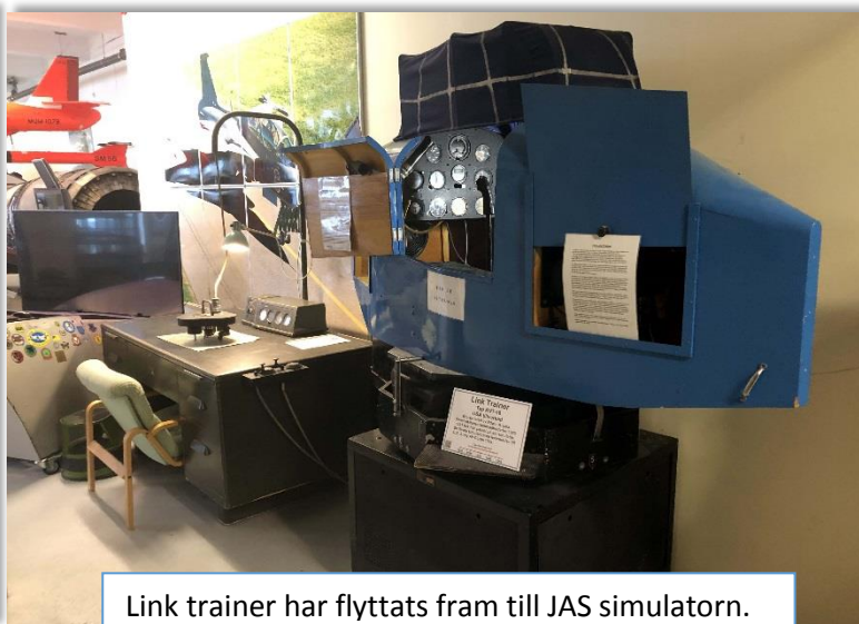
Link trainer har flyttats fram till JAS simulatorm.