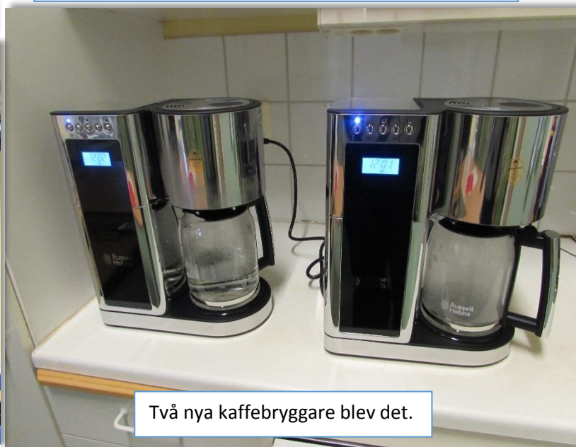
Två nya kaffebryggare blev det.