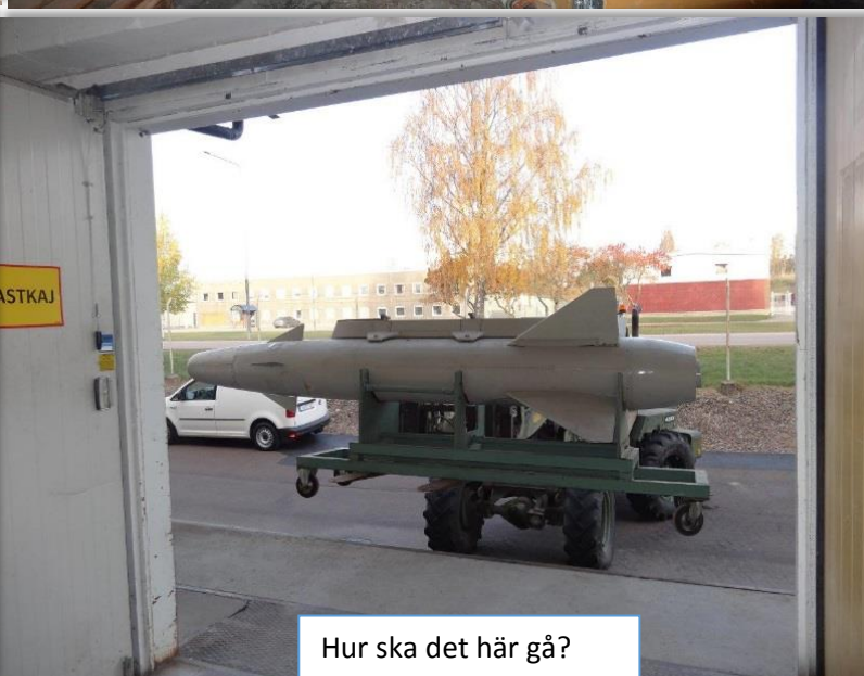
Hur ska det här gå?