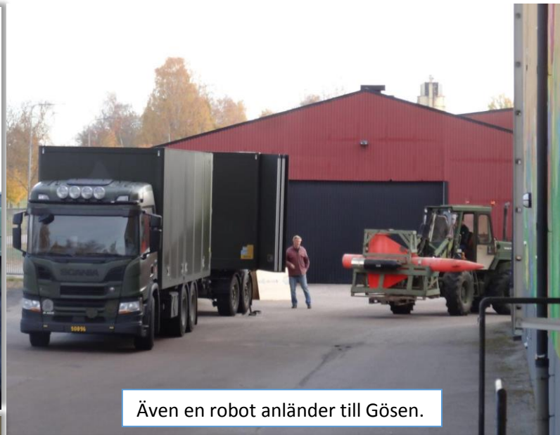
Även en robot anländer till Gösen.