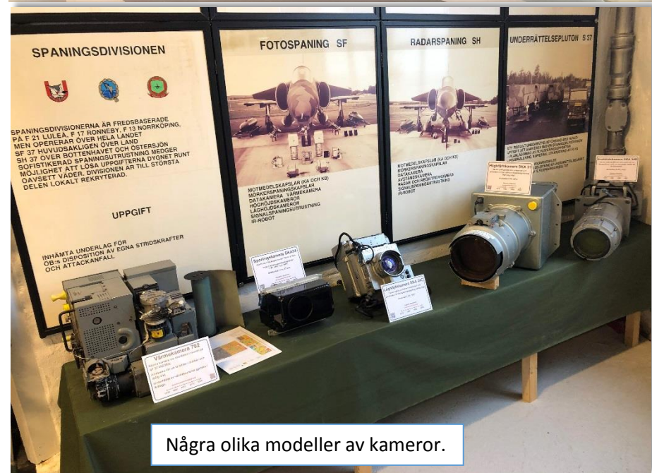
Några olika modeller av kameror.