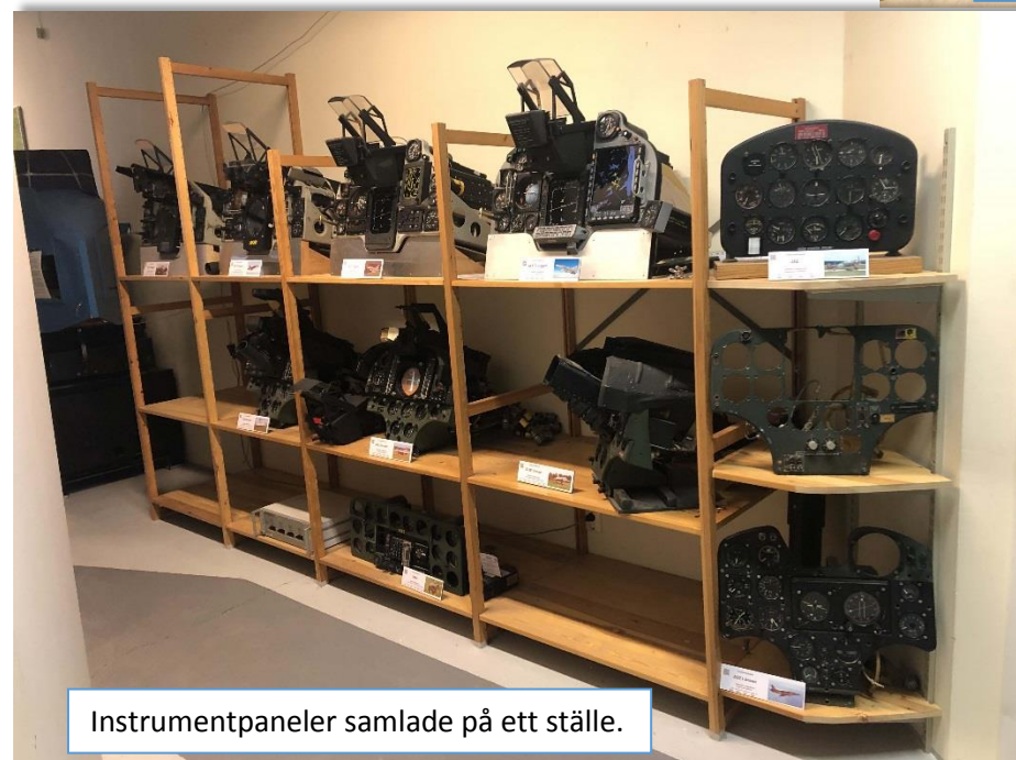
Instrumentpaneler samlade på ett ställe.