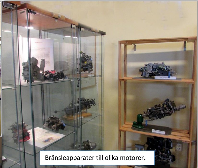
Bränsleapparater till olika motorer.