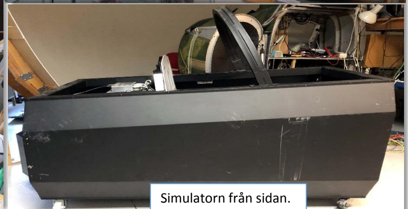
Simulatorn från sidan.

Det finns mycket att göra på museet just nu, men vi är tyvärr inte så många aktiva. Vi har stort behov att få hit flera aktiva medlemmar som kan hjälpa till. Vi behöver personer med t.ex. datorkunskap, guider vid besök, registrera dokumentation som hela tiden strömmar in. Hjälpa till med olika projekt små och stora. Museet är ju hela tiden i förändring för att överraska vår besökare så det blir en ny upplevelse vid varje besök. Hör gärna av er. Ni är varmt välkomna.