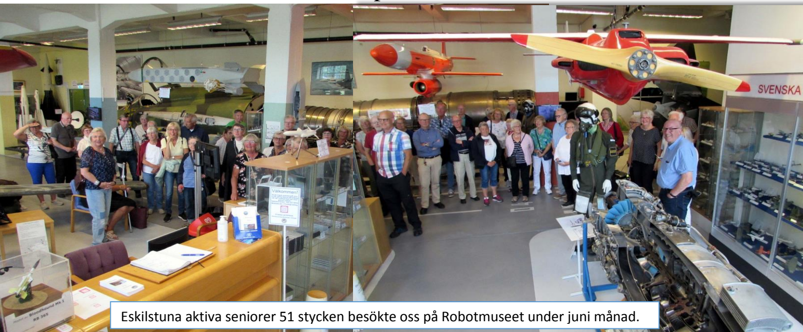
Eskilstuna aktiva seniorer 51 stycken besökte oss på Robotmuseet under juni månad.