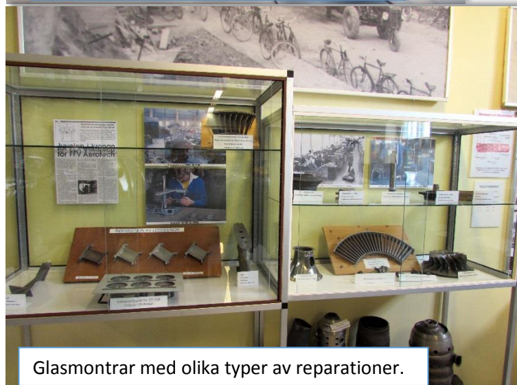
Glasmontrar med olika typer av reparationer.