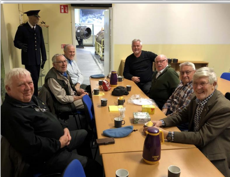
Besök av FN veteraner Västmanland.