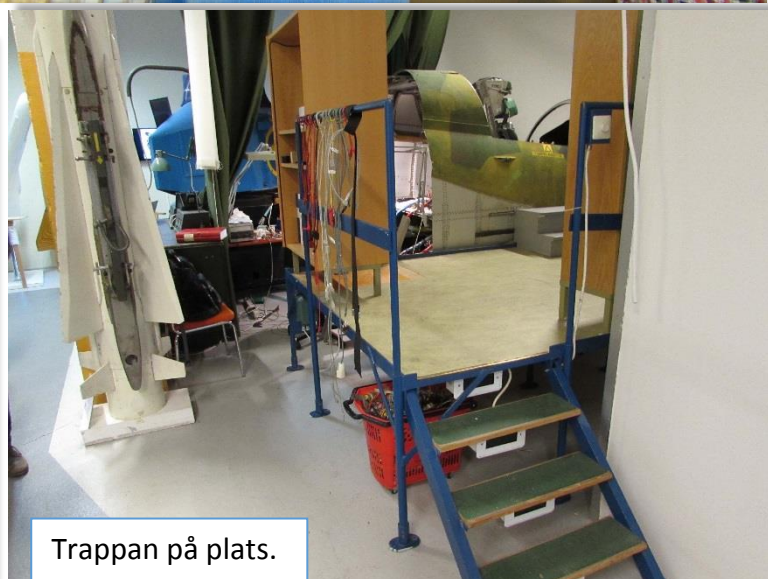
Trappan på plats.