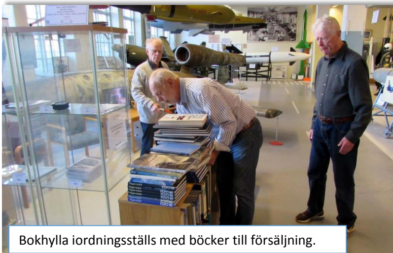
Bokhylla iordningsställs med böcker till försäljning.