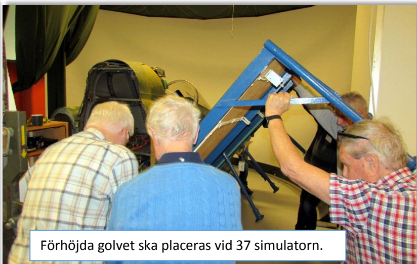
Förhöjda golvet ska placeras vid 37 simulatorn.