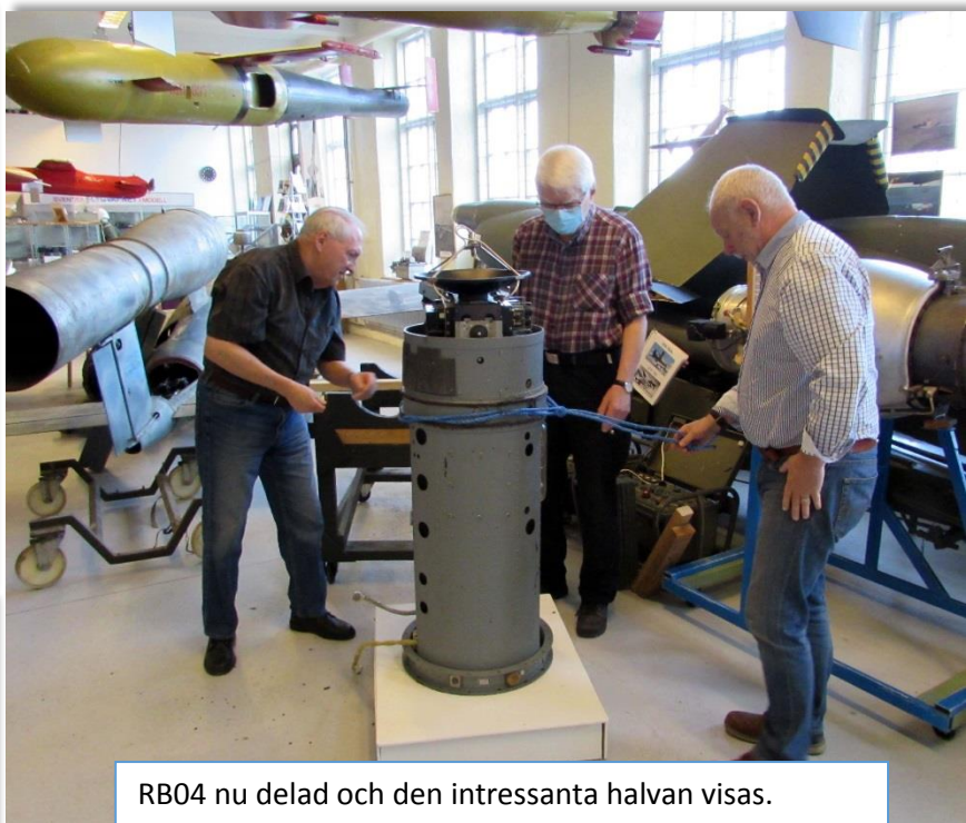
RB04 nu delad och den intressanta halvan visas.