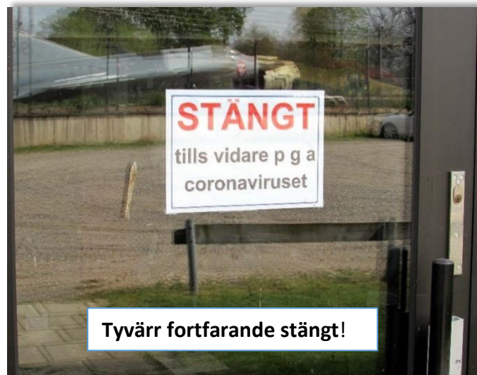
Tyvärr fortfarande stängt!