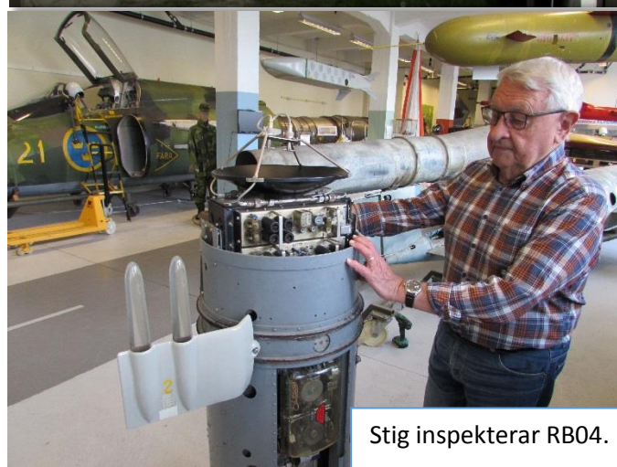
Stig inspekterar RB04.