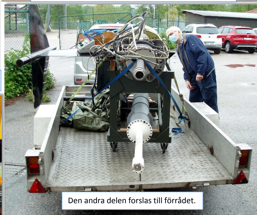
Den andra delen forslas till förrådet.