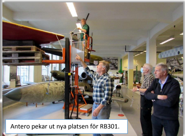
Antero pekar ut nya platsen för RB301.