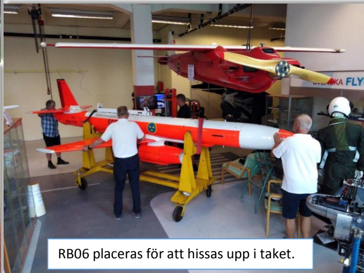
RB06 placeras för att hissas upp i taket.