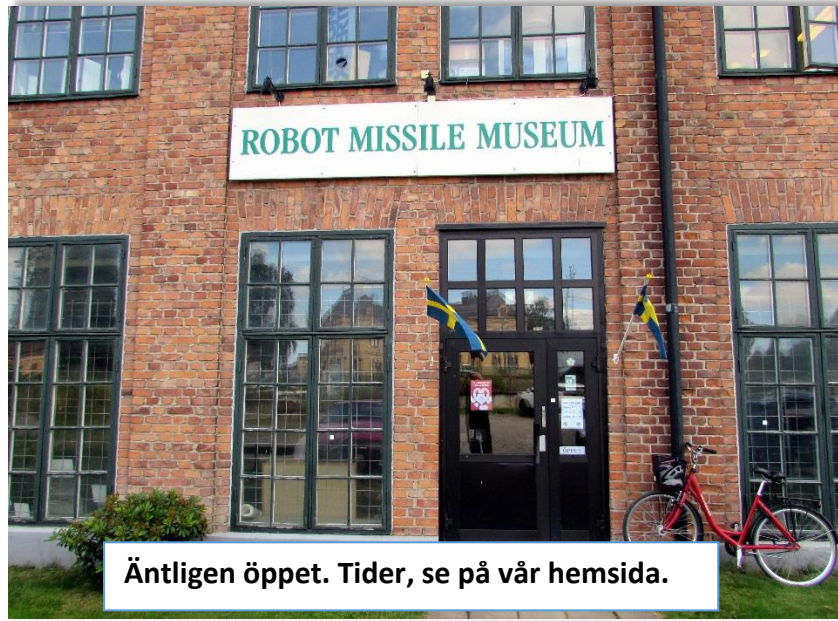
Äntligen öppet. Tider, se på vår hemsida.