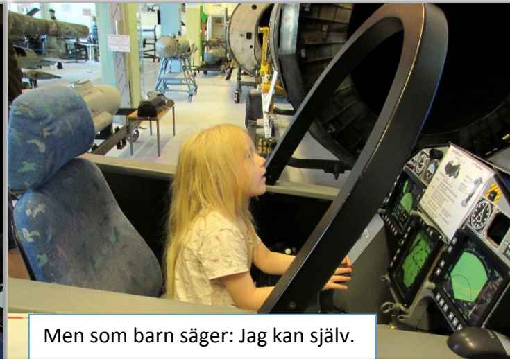
Men som barn säger: Jag kan själv.