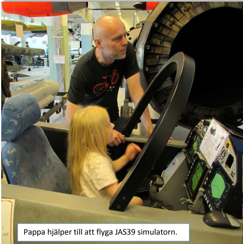
Pappa hjälper till att flyga JAS39 simulatören.