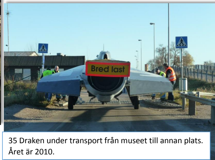
35 Draken under transport från museet till annan plats. Året är 2010.