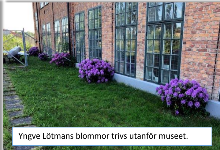
Yngve Lötman's blommor trivs utanför museet.