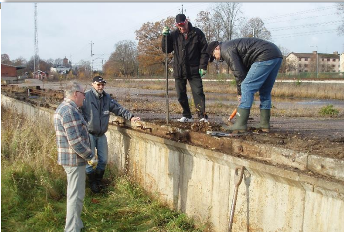
Förberedelser för att få upp staket. Runt utställningsplatsen 2010.