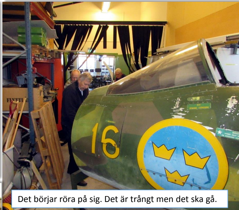
Det börjar röra på sig. Det är trångt men det ska gå.