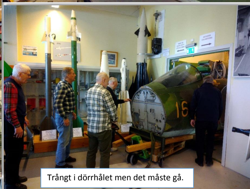
Trångt i dörrhålet men det måste gå.