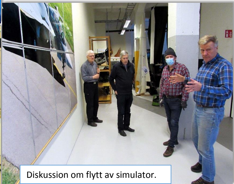
Diskussion om flytt av simulator.