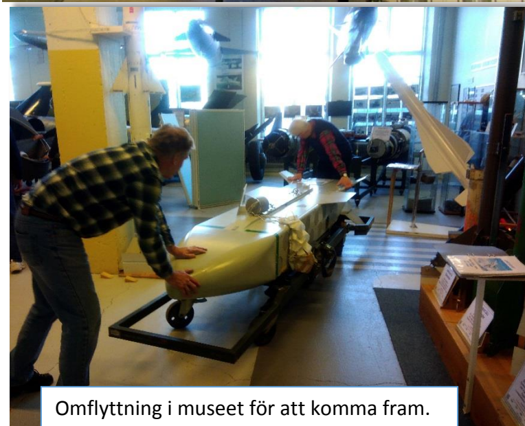
Omflyttning i museet för att komma fram.