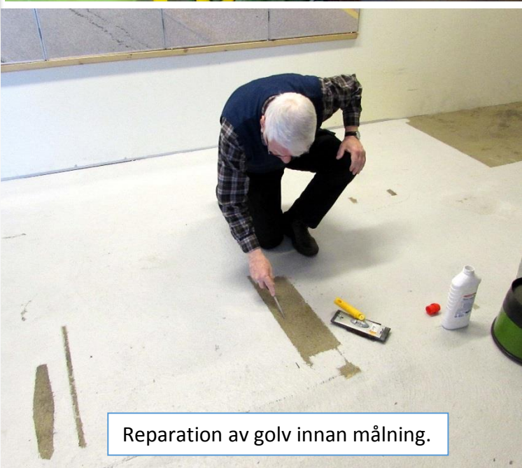
Reparation av golv innan målning.