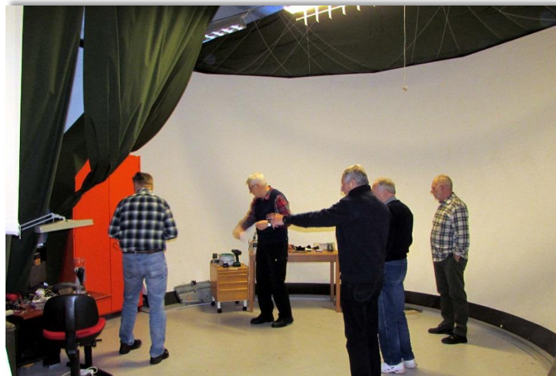
Förberedelser att placera 37 Viggen på sin plats.