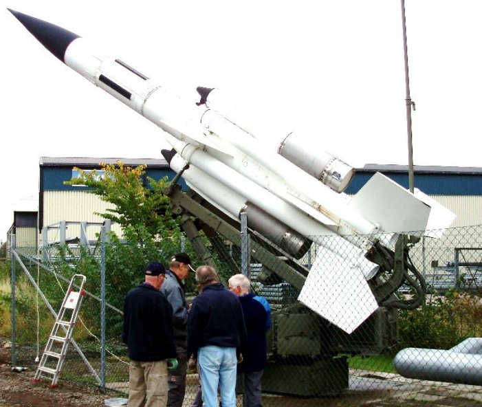
Robot 68 ska få ett staket omkring sig för att skyddas från åverkan.