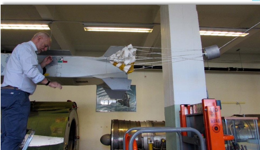
En av alla små fallskärmarna riggas upp för att visa hur det såg ut när dom skickades iväg från själva kapseln.