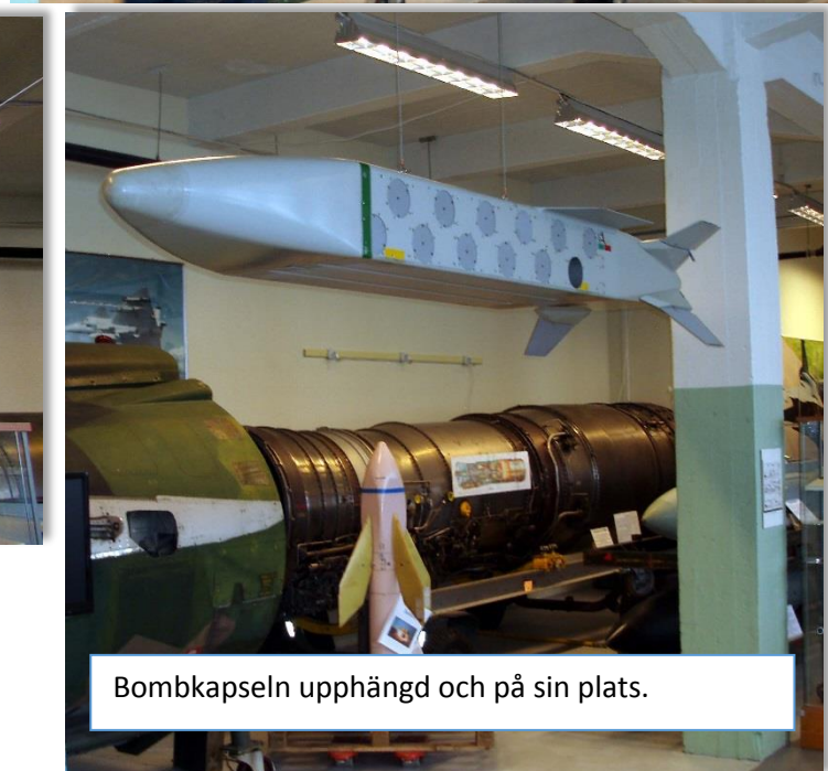
Bombkapseln upphängd och på sin plats.