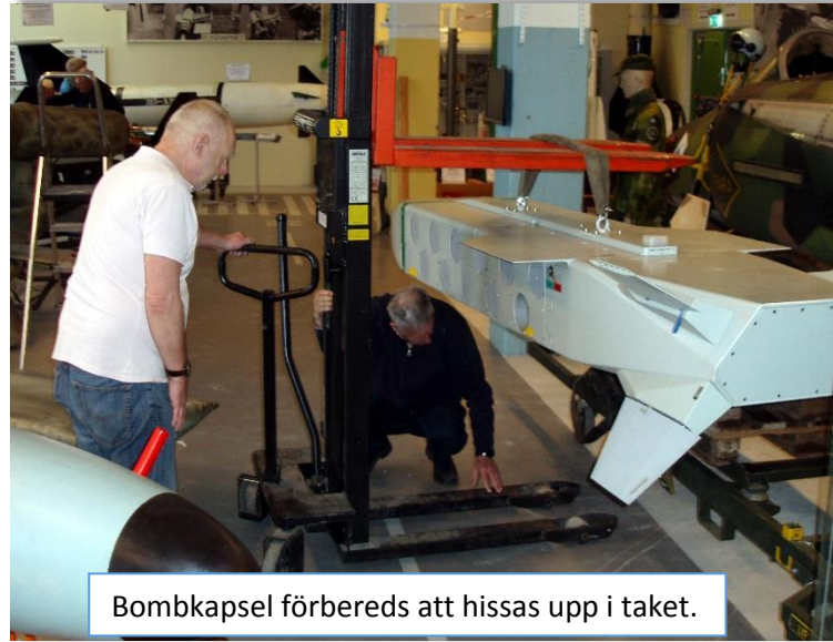
Bombkapsel förbereds att hissas upp i taket.