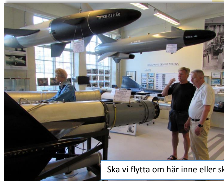
Ska vi flytta om här inne eller ska vi städa upp på framsidan?