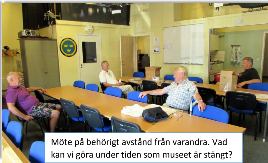
Möte på behörigt avstånd från varandra. Vad kan vi göra under tiden som museet är stängt?