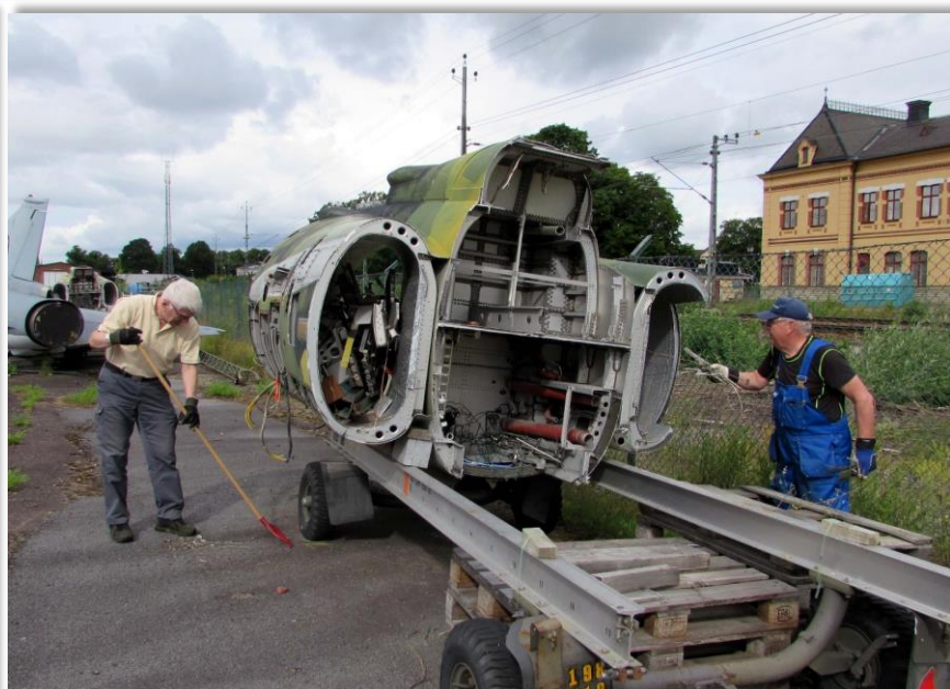
Vi samlar ihop alla överblivna delar efter delningen av kroppen till 37 Vigen.