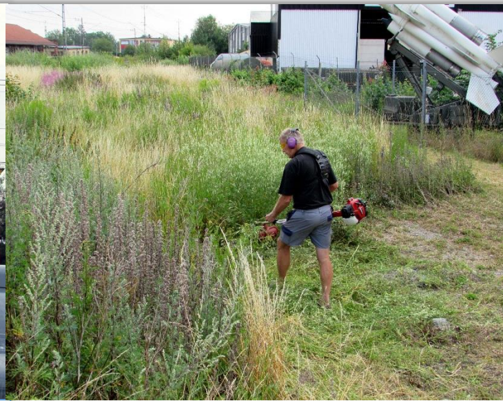
Antero röjer bort ogräset. Hittade ett jordgetingbo som störde arbetet.