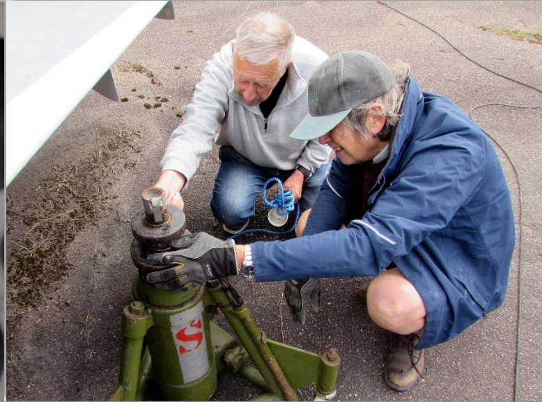
Hur fungerar den här domkraften? Går den under vingen?