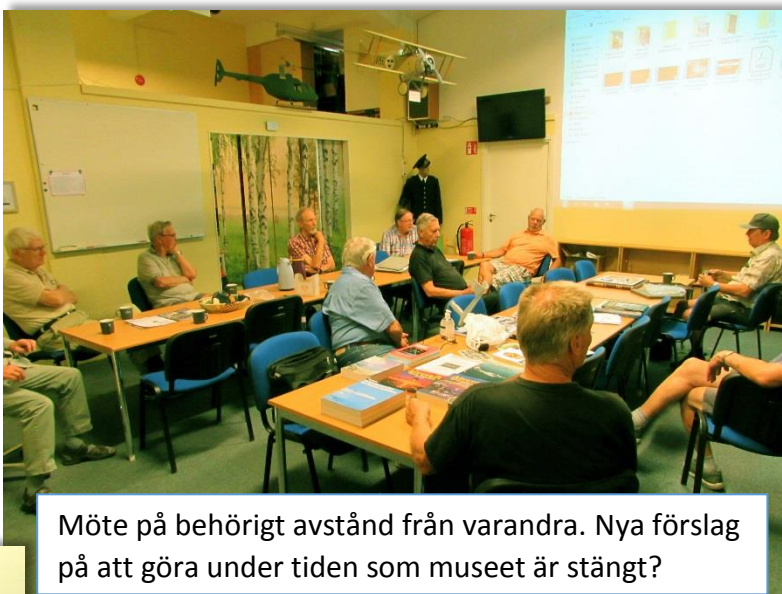
Möte på behörigt avstånd från varandra. Nya förslag på att göra under tiden som museet är stängt?