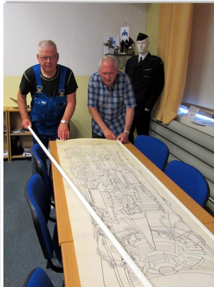
En ritning över hela RM8 motorn sätts upp på en tavla..