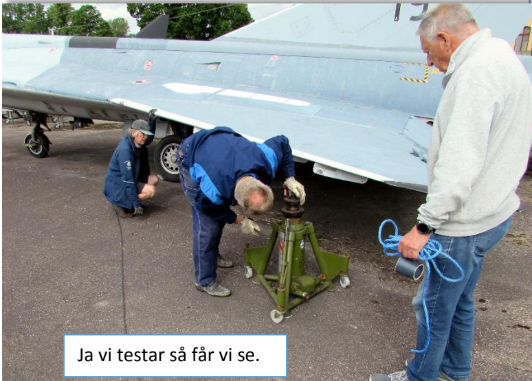
Ja vi testar så får vi se.