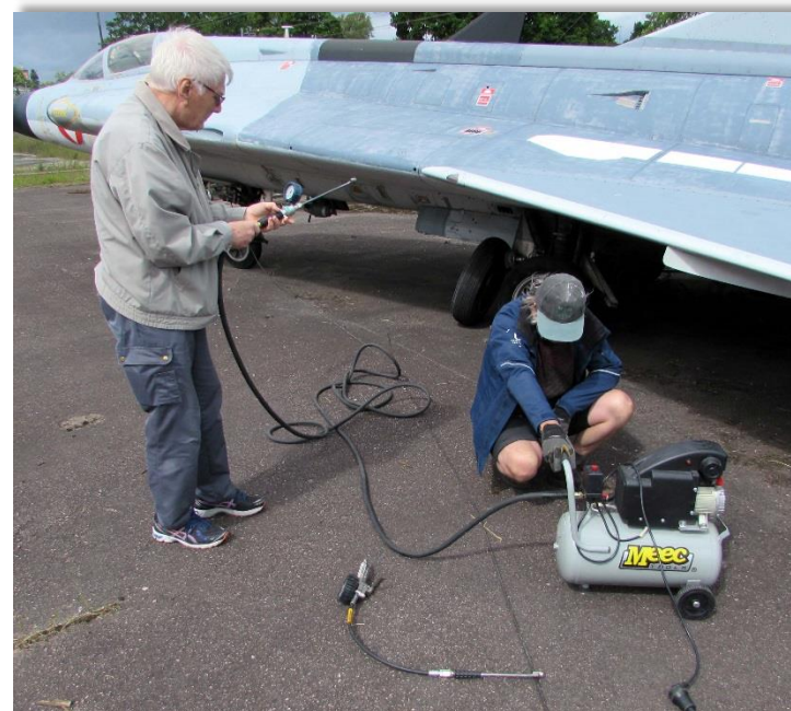
Dags att kolla luften i 35 Draken. Det är ju inte bara att stanna till vid macken o få luften kollad.