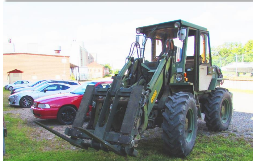
Antero med sin hjullastare användes vid nerplockning av RB04.