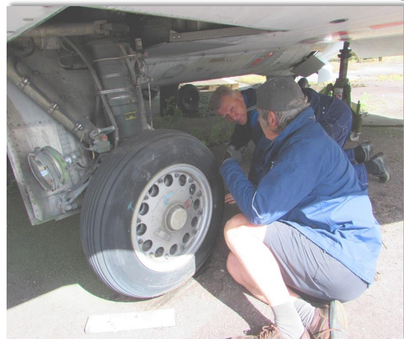
Ja det funkade nu är hjulet hängande fritt.