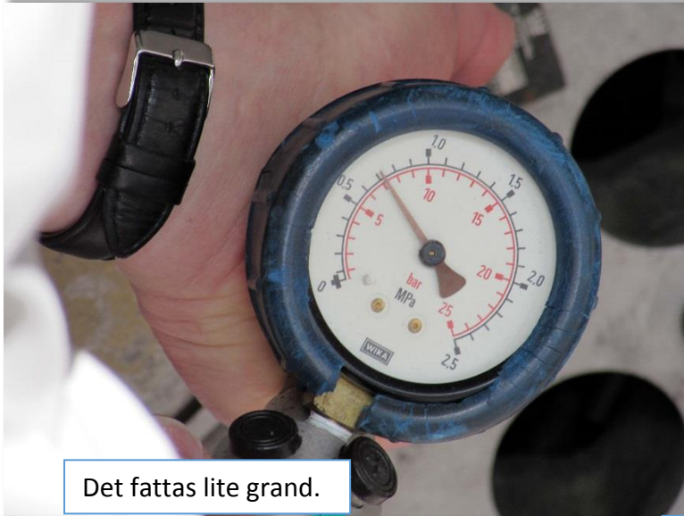
Det fattas lite grand.