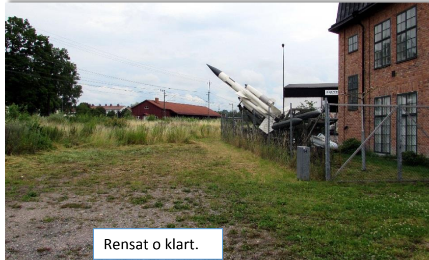
Rensat o klart.