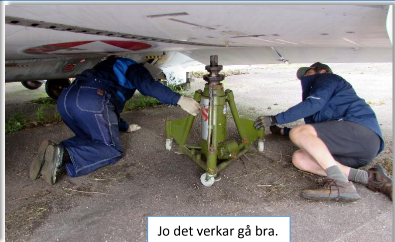
Jo det verkar gå bra.