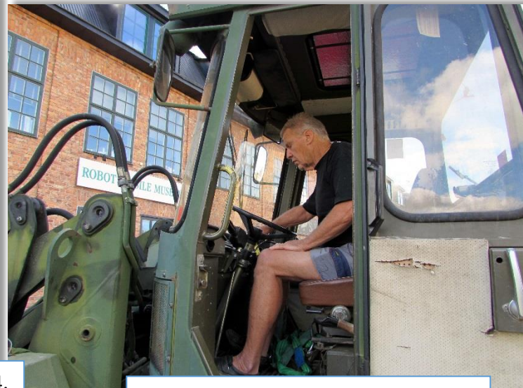
Hur var det man startade nu igen?