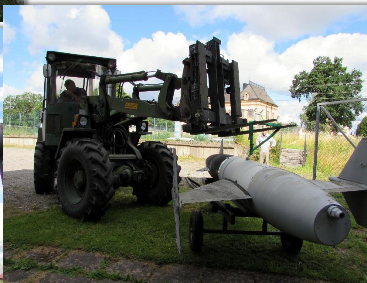
Roboten står snart på fast mark för uppsnygning.