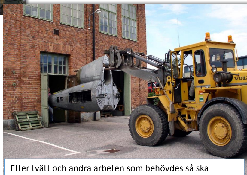
Efter tvätt och andra arbeten som behövdes så ska kroppen in i på rätt ställe för att bli en simulator på museet. Denna plats blev senare utbytt mot ett mer anpassat utrymme där den finns idag.