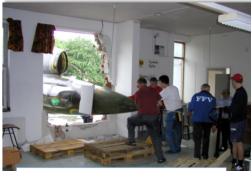
Nu är den på väg ut genom öppningen i väggen.