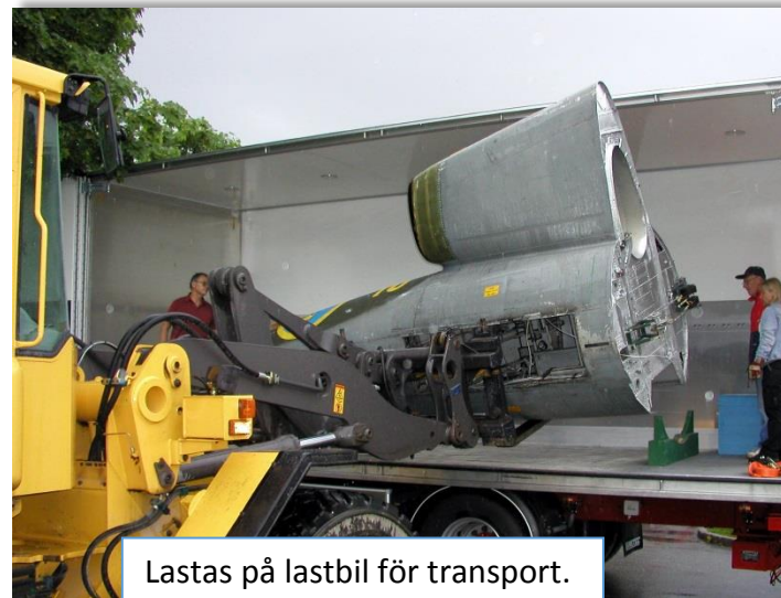
Lastas på lastbil för transport.