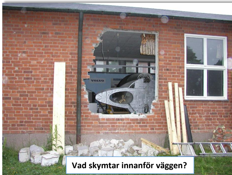
Vad skymtar innanför väggen?