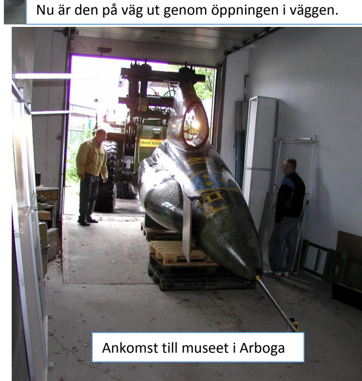
Ankomst till museet i Arboga