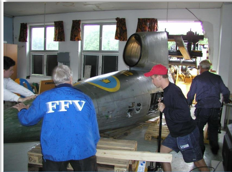
Jo framkroppen till J35 Draken som ska forslas till Arboga.