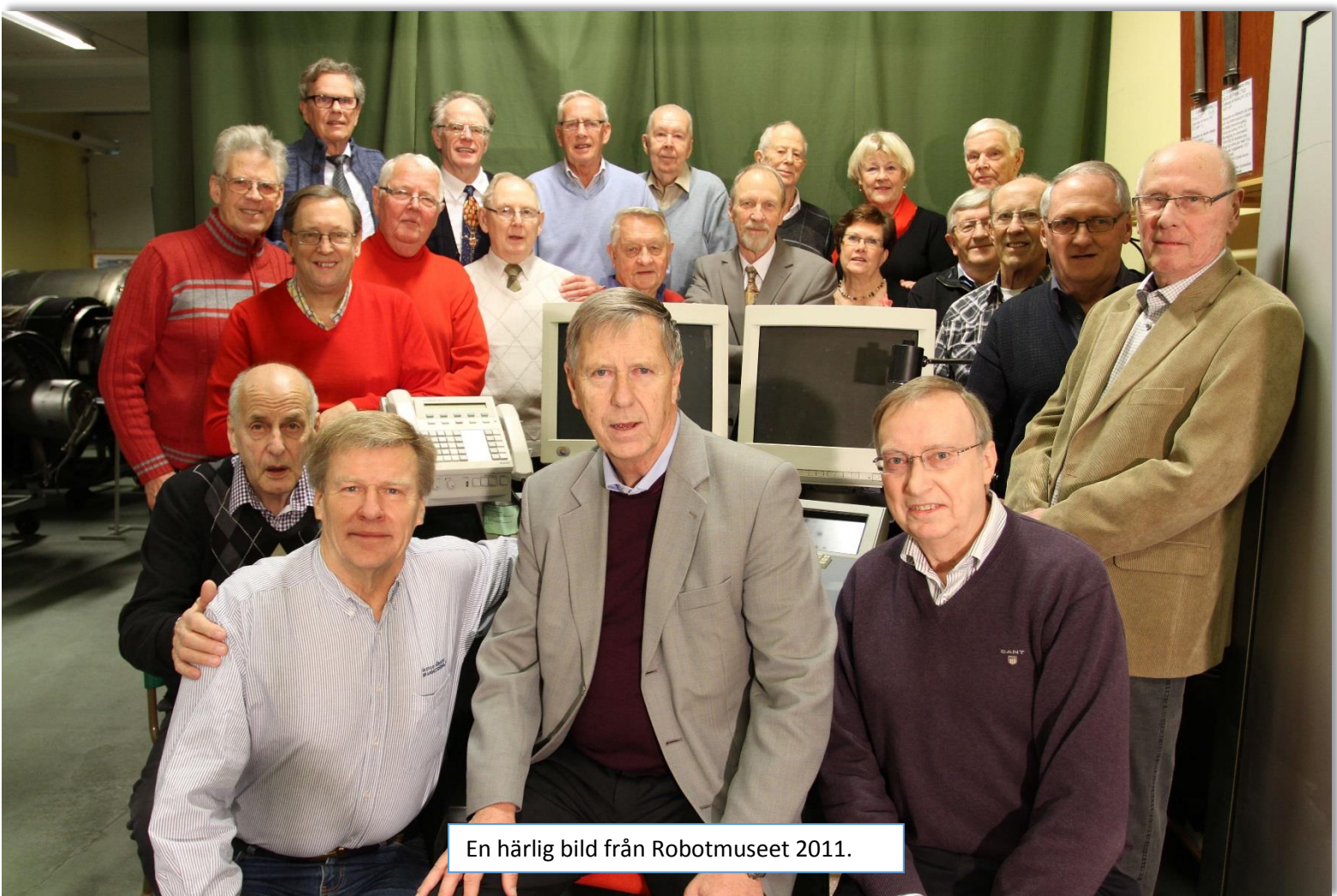
En härlig bild från Robotmuseet 2011.