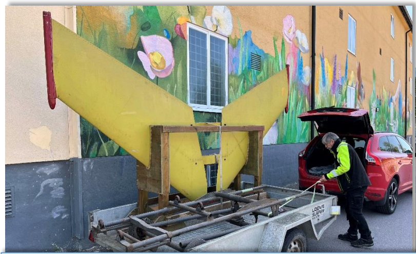
Stefan spänner fast vingen och monteringsvagnen för pulsmotorn med spännband inför transporten till Robotmuseet