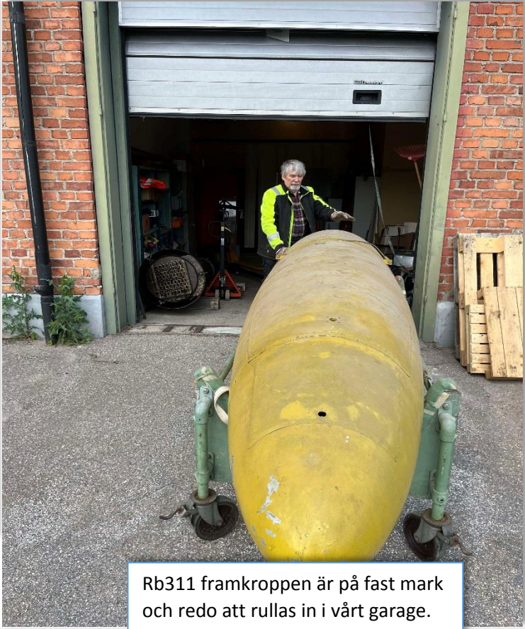
Rb311 framkroppen är på fast mark och redo att rullas in i vårt garage.