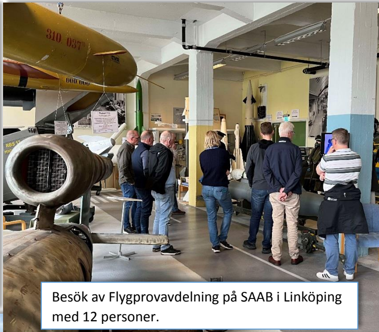
Besök av Flygprovavdelning på SAAB i Linköping med 12 personer.