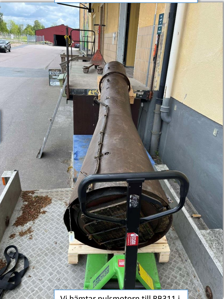
Vi hämtar pulsmotorn till RB311 i Gösen till Robotmuseet.