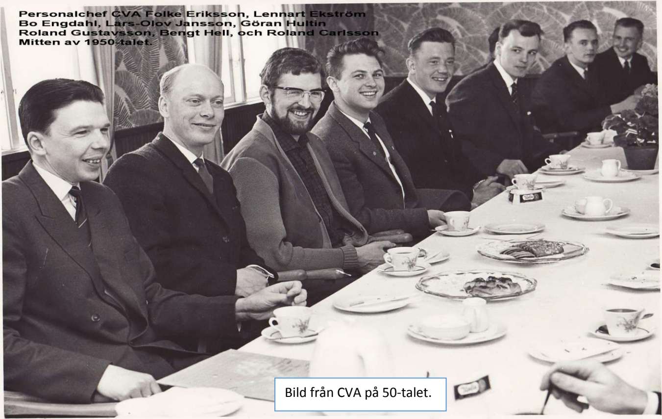
Bild från CVA på 50-talet.