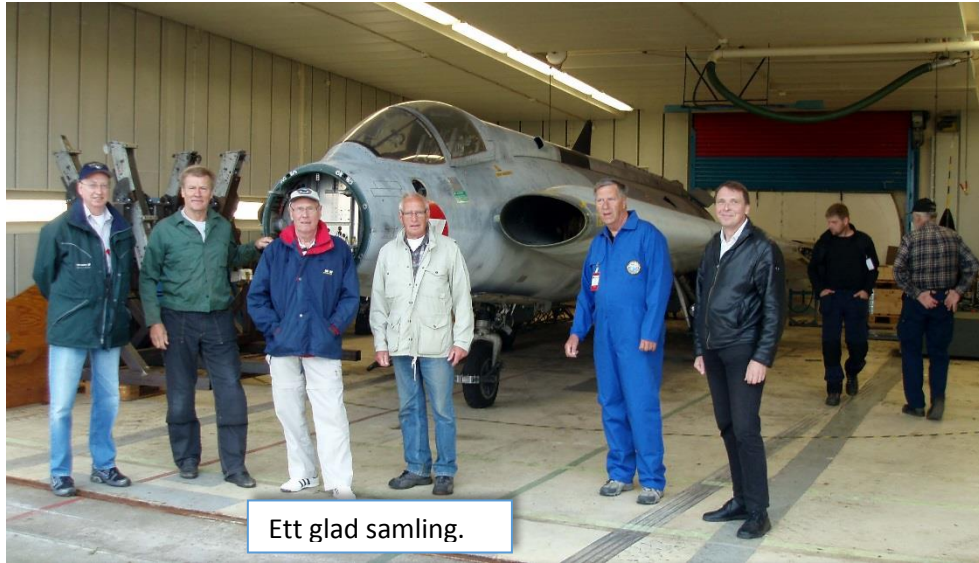
Ett glad samling.