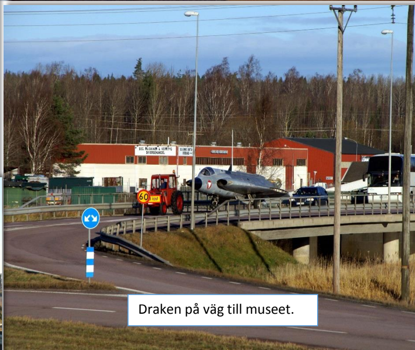
Draken på väg till museet.