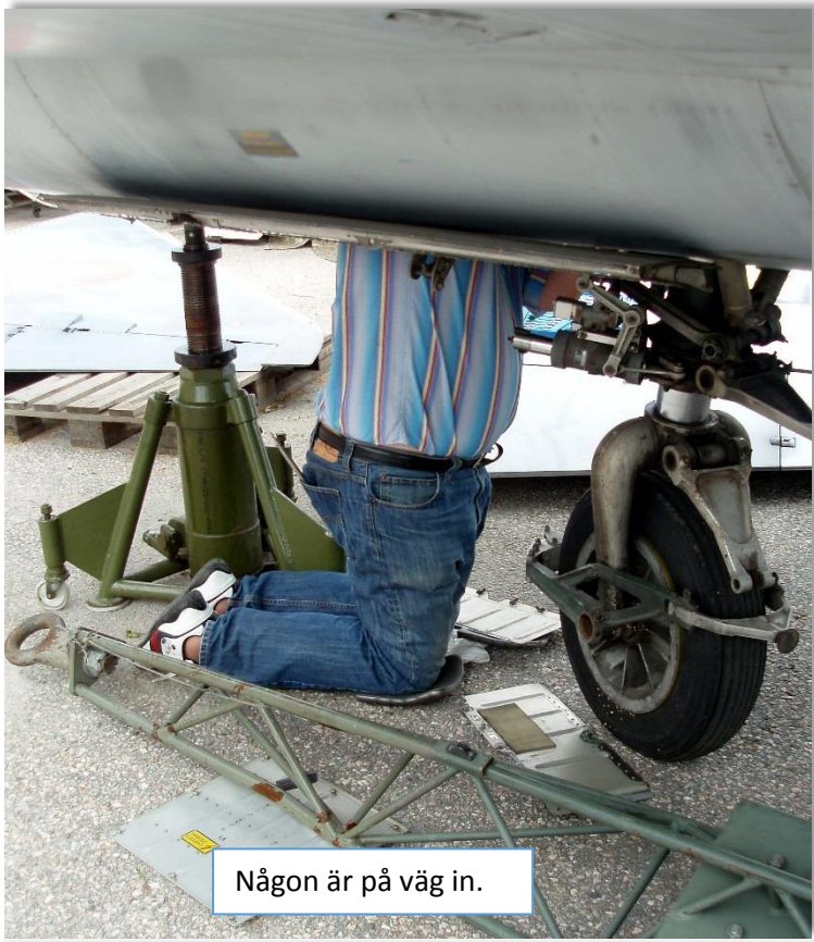
Någon är på väg in.