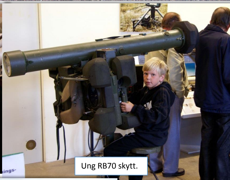
Ung RB70 skytt.