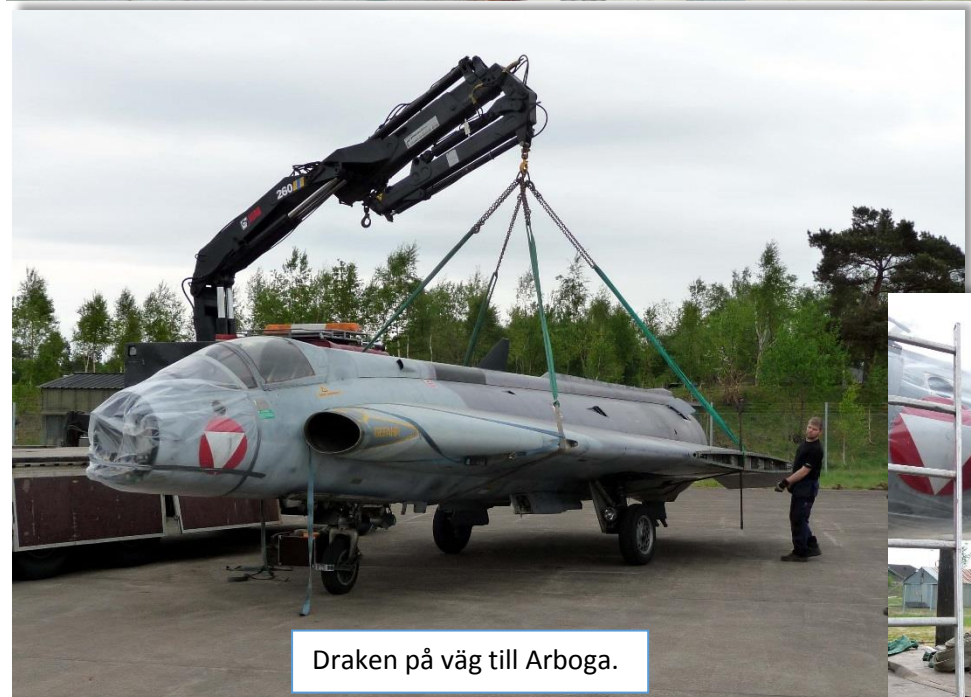
Draken på väg till Arboga.