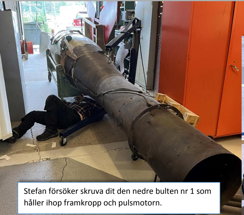
Stefan försöker skruva dit den nedre bulten nr 1 som håller ihop framkropp och pulsmotorn.