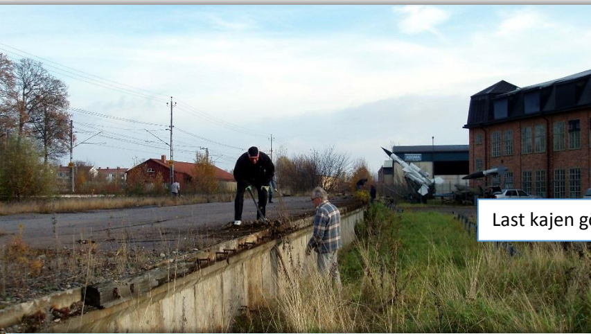
Last kajen görs i ordning.