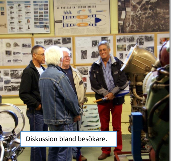
Diskussion bland besökare.