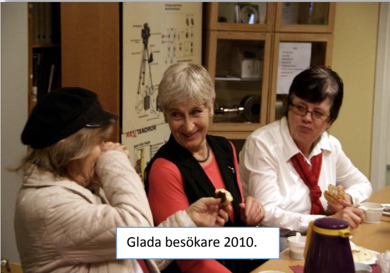
Glada besökare 2010.