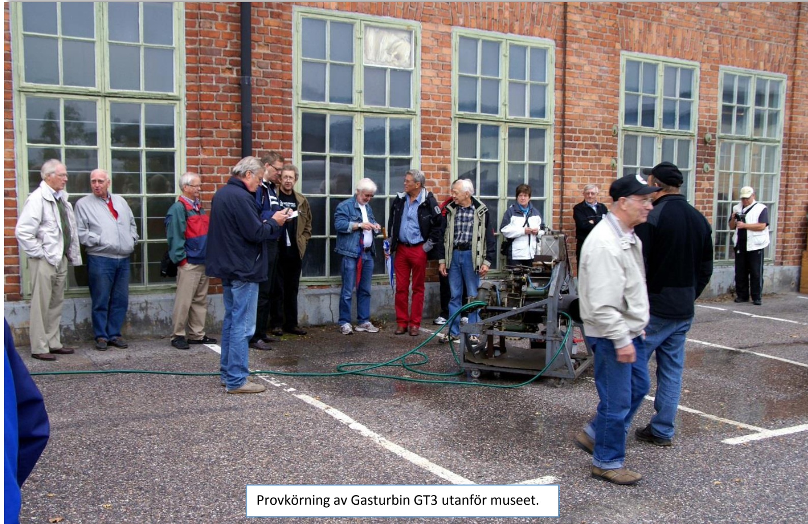
Provkörning av Gasturbin GT3 utanför museet.