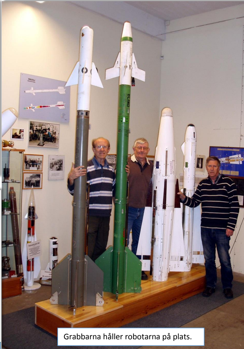
Grabbarna håller robotarna på plats.

Föredraget hålls i Arboga på Robotmuseet den 16/11 kl: 18.30 – 21.00