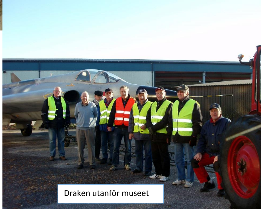
Draken utanför museet