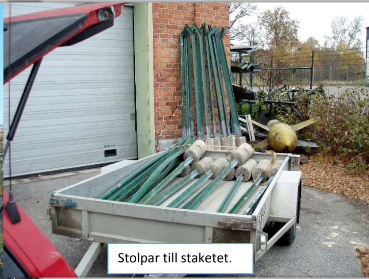
Stolpar till staketet.