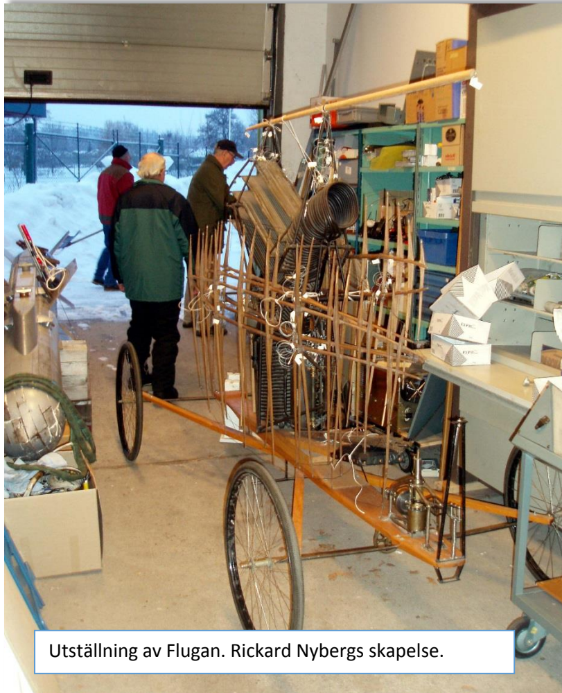
Utställning av Flugan. Rickard Nybergs skapelse.