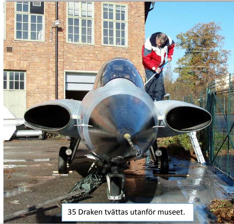
35 Draken tvättas utanför museet.