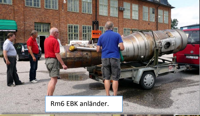
Rm6 EBK anländer.