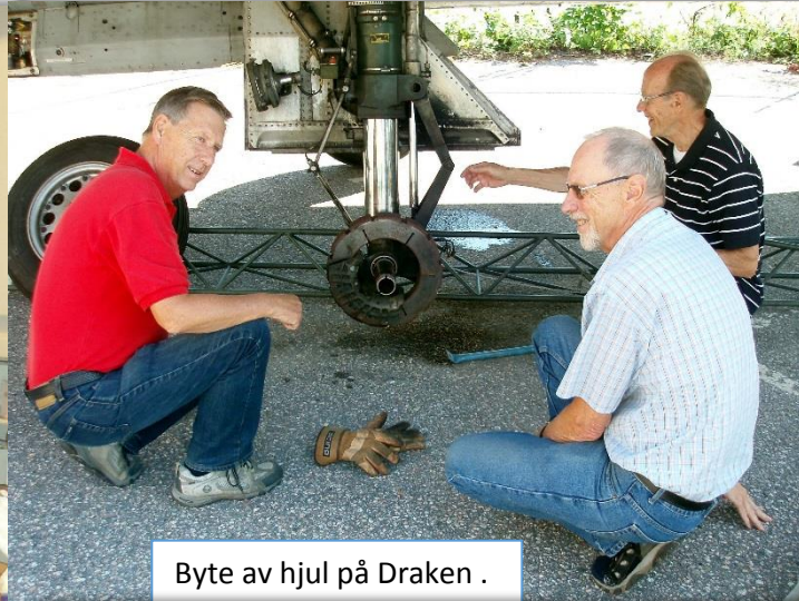
Byte av hjul på Draken .