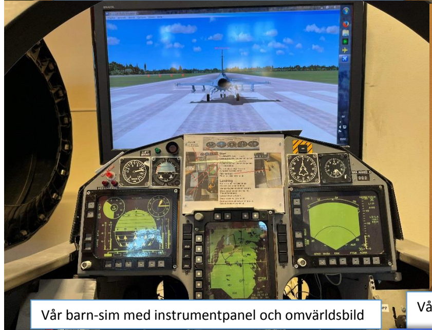
Vår barn-sim med instrumentpanel och omvärldsbild