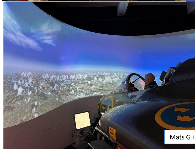
Mats G i J35B-sim