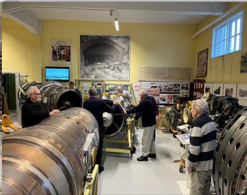
Tillbaka flytt av RM5 motorn efter byte av lysrör i taket.