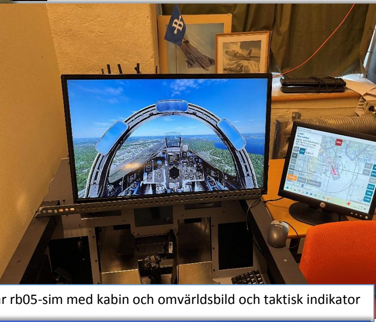
Vår rb05-sim med kabin och omvärldsbild och taktisk indikator