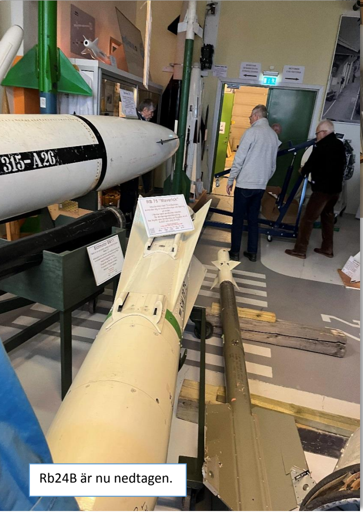
Rb24B är nu nedtagen.