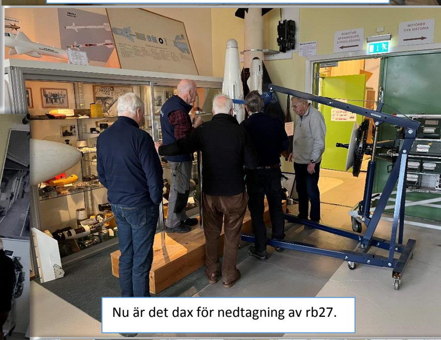
Nu är det dax för nedtagning av rb27.