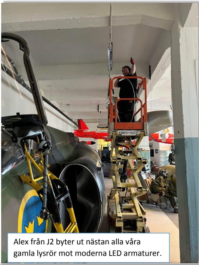
Alex från J2 byter ut nästan alla våra gamla lysrör mot moderna LED armaturer.