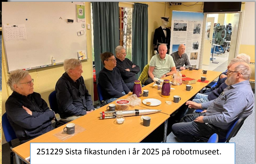
251229 Sista fikastunden i år 2025 på robotmuseet.