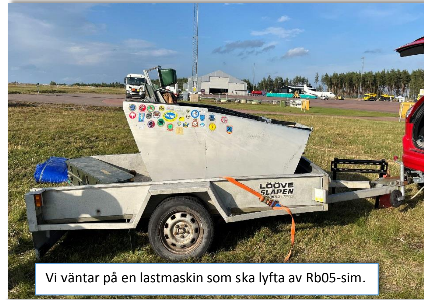
Vi väntar på en lastmaskin som ska lyfta av Rb05-sim.