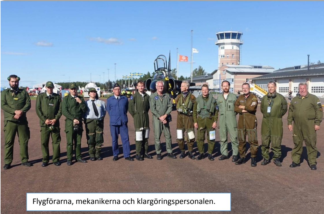
Flygförarna, mekanikerna och klargöringspersonalen.