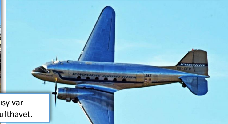
DC-3 Daisy var också i lufthavet.