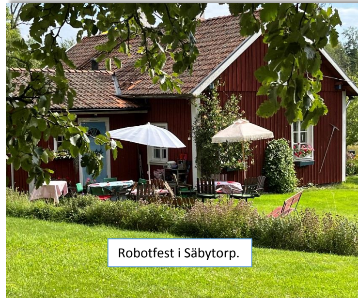
Robotfest i Säbytorp.