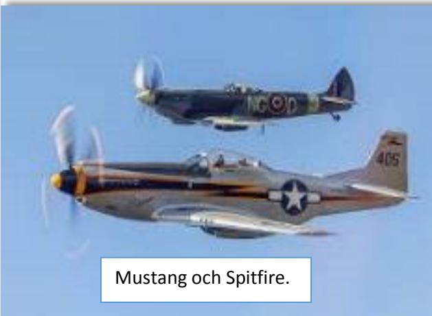
Mustang och Spitfire.