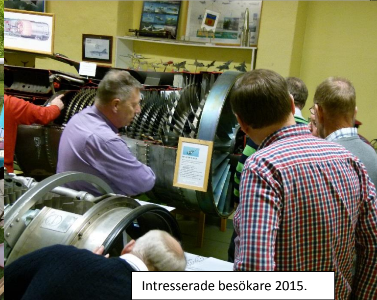
Intresserade besökare 2015.