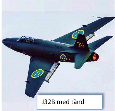
J32B med tänd