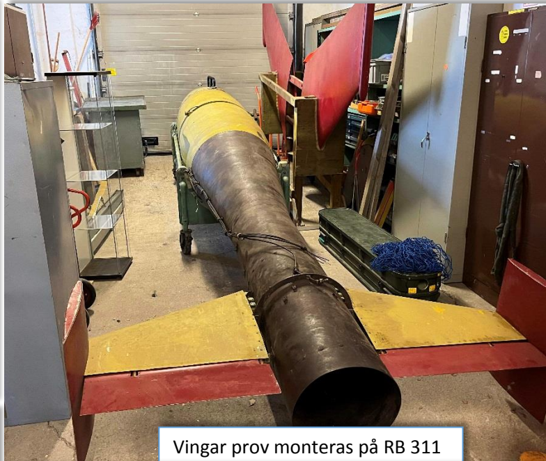
Vingar prov monteras på RB 311