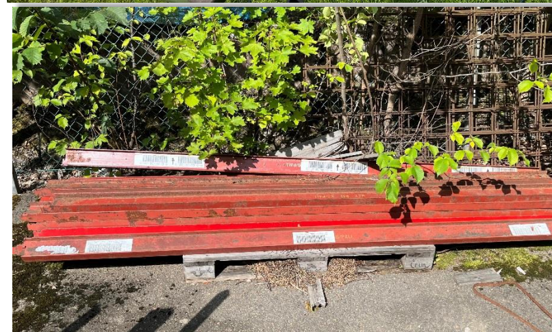
Antero har fått sponsring av KLK med I-balkar till museet.