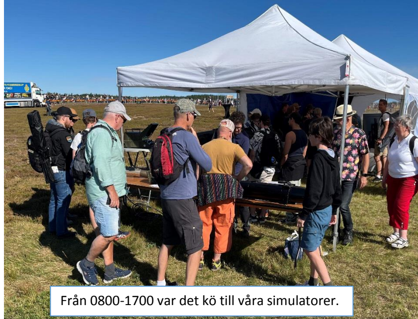
Från 0800-1700 var det kö till våra simulatorer.