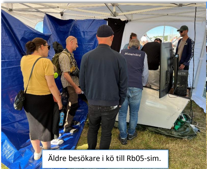
Äldre besökare i kö till Rb05-sim.