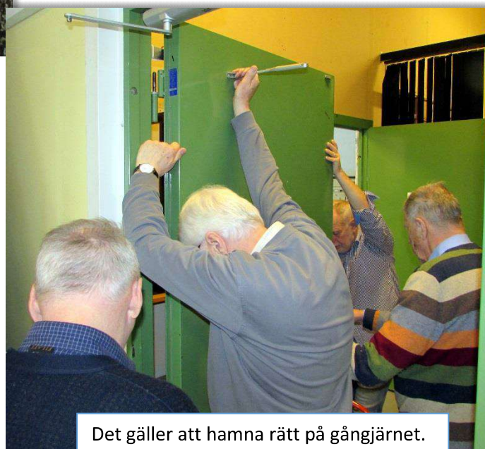
Det gäller att hamna rätt på gångjärnet.