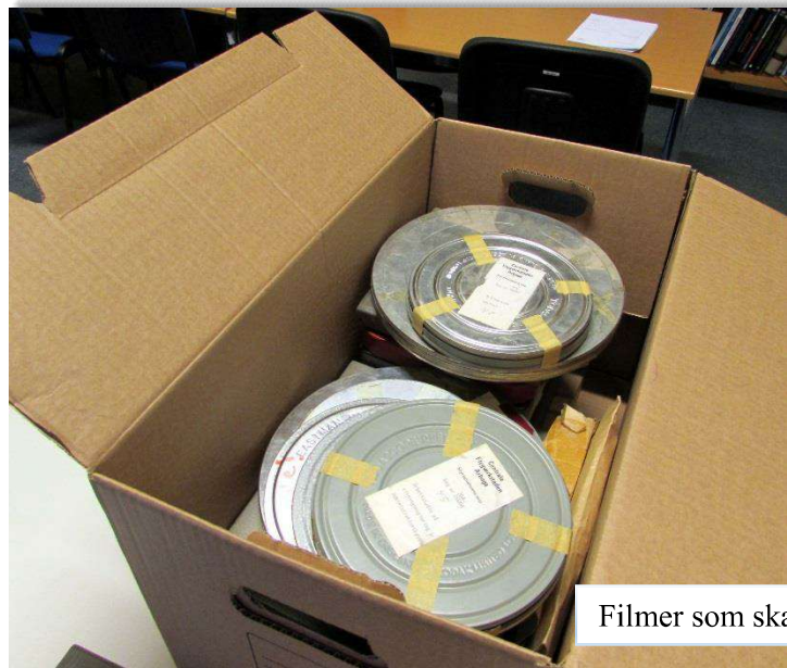
Filmer som ska överföras till DVD