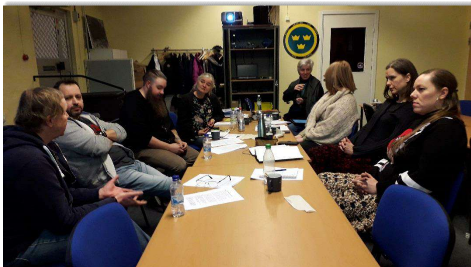
Arboga bibliotek var till oss en dag och blev guidade runt på museet.