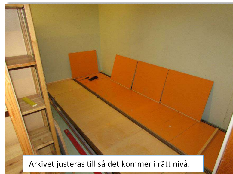
Arkivet justeras till så det kommer i rätt nivå.