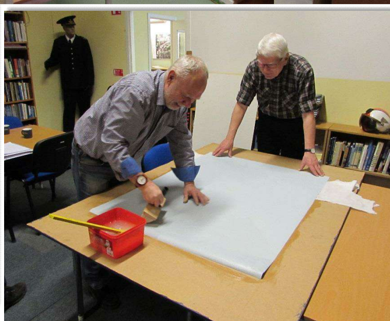
Limning av tapeten som sen ska fästas på arkivets gavel.