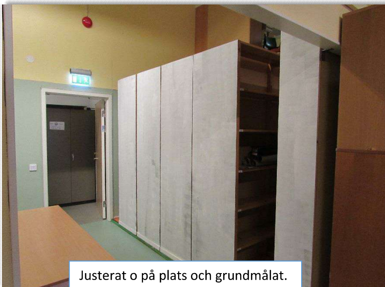
Justerat o på plats och grundmålat.