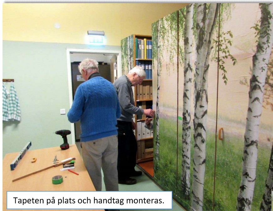
Tapeten på plats och handtag monteras.