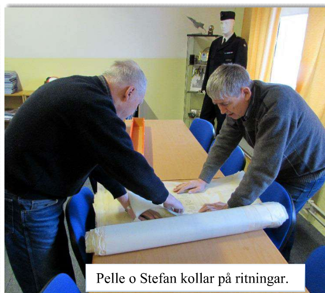
Pelle o Stefan kollar på ritningar.