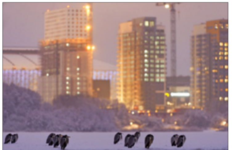
Gråhäger syns varje vinter vid Råstasjöns västra sida.