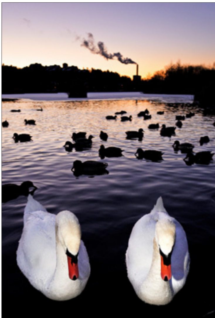
Ett knölsvanspar guppar i Råstasjön. Dimslöjans värmeverk i Storsko- gen tronar i bakgrunden.