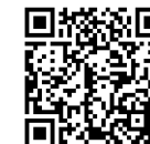
Spellista, MCP foder RaaTec

Rikta kameran i din iPhone mot QR-koden eller gå till raatec.com/mcp-foder-2/