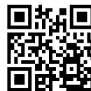
Tessa på Bollerup

Se gärna våra filmer med kunder där produkterna används i praktiken.