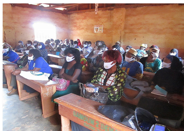
▲ Ondanks de coronacrisis en bijhorende maatregelen, konden vormingsmomenten van de Ecole Sans Violence doorgaan.