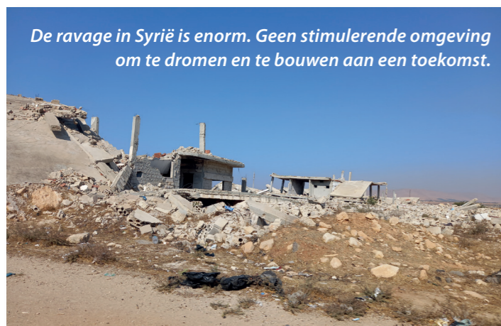
De ravage in Syrië is enorm. Geen stimulerende omgeving om te dromen en te bouwen aan een toekomst.