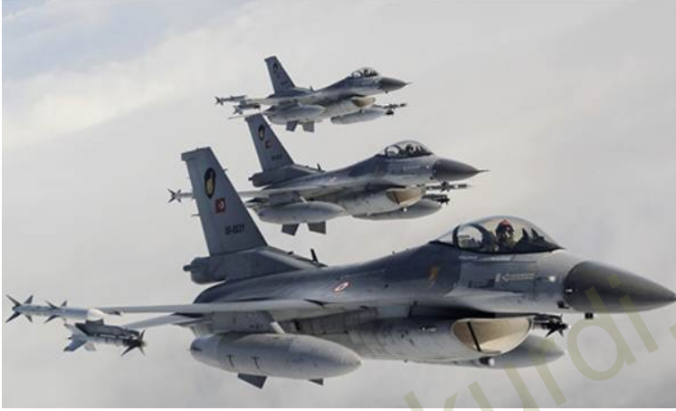
Türklerin F 16 Savaş Uçakları