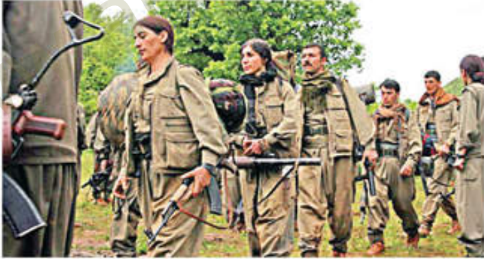
Silaha Sarılmış Kürtler

Yunanlılar veya Ruslar her kimse, Amerikalılar, neden onları silahlandırıp dağa çıkarmıyor?