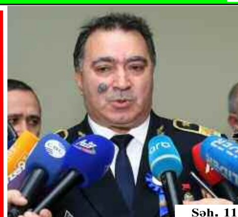
Səh. 11 SABİTLİYİN YARADICISI - HEYDƏR ƏLİYEV

GÜLLƏ ATMADAN HAKİMİYYƏTƏ GƏLƏN DÜNYA SİYASƏTÇİSİ Səh. 6-7