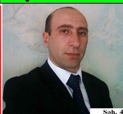
Səh. 4 XALQIMIZIN ÜMUMMİLLİ LİDERİ HEYDƏR ƏLİYEV DÖVLƏTİMİZİN MÜSTƏQİLLİYİNİ ƏBƏDİLƏŞDİRDİ

KQB generalı Titkov: "Qorbaçov Əliyevdən qorxurdu" Səh. 15