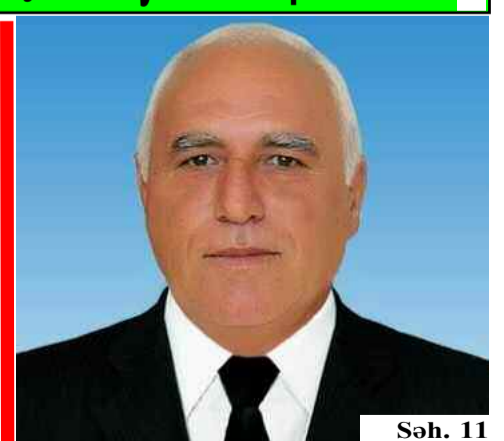
Səh. 11 EL ATASI