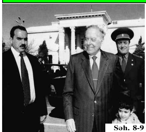
Səh. 8-9 ÖMRÜNÜ-GÜNÜNÜ XALQINA HƏSR EDƏN DAHİ İNSAN