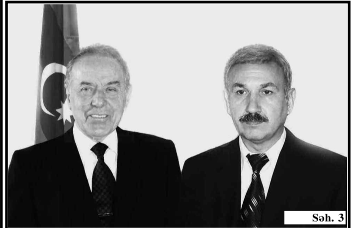
Səh. 3 ULU ÖNDƏR HƏR ZAMAN BİZİMLƏDİR

Dünya ümummilli lider Heydər Əliyev haqqında Səh. 4