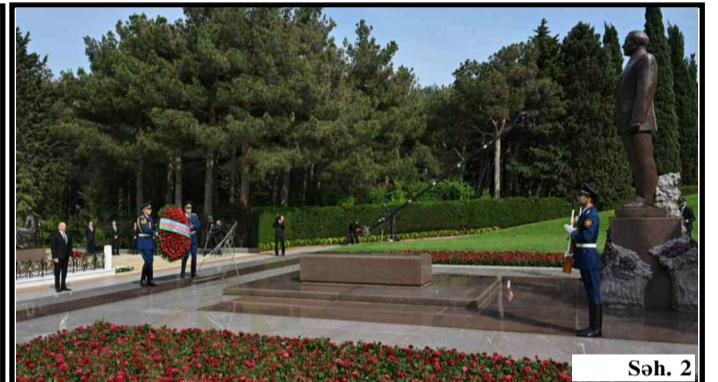
Səh. 2 Prezident İlham Əliyev, birinci xanım Mehriban Əliyeva və ailə üzvləri Ulu Öndər Heydər Əliyevin Fəxri xiyabanda məzarını ziyarət ediblər