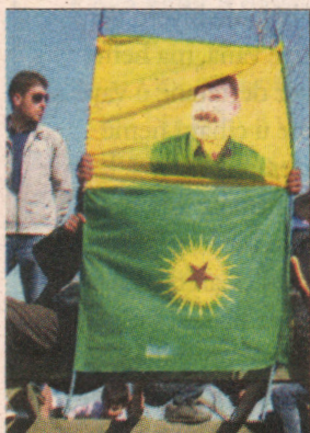
Newroza Amedî manîfesto yo