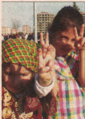
Kurd her hawa ra hêşyar bîyo