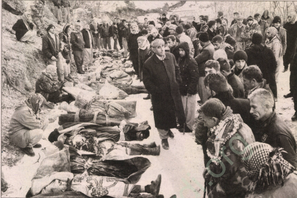
'Dewletî qirkerdiş qebûl kerd' Kaplanî wina devam kerd: "Bi no hawayê dewletî kişteke bînî zî vejya

Dosyaya ke derheqê Roboskê de amede bibî şirawitê Dozgeriya lejkerî ya Komitaneya Kolordîya 7'in a Amedî. Ney sero zî sifte BDPîjan betekê xo mojnay û ardî ziwna ke no hawa taktîk goreya tarîxî, serê qirkerdişî girotiş o.