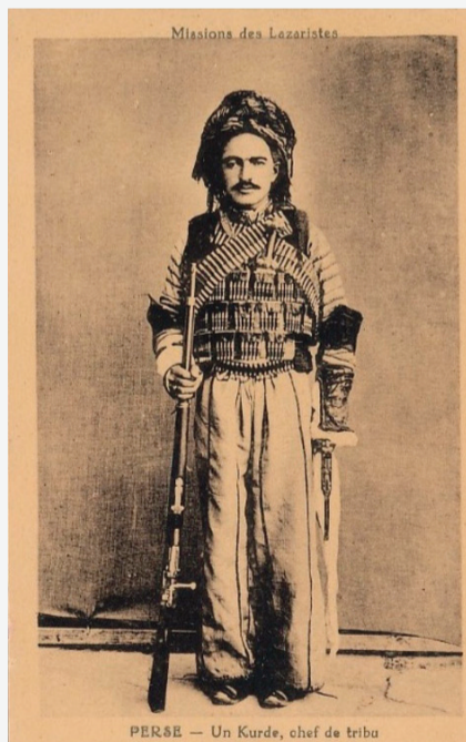
Un Kurde, chef de tribu (yew kurd, serekê eşîre)