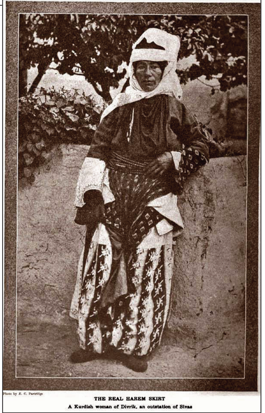
THE REAL HAREM SKIRT A Kurdish woman of Divrik, an outstation of Sivas

The Real Harem Skirt - A Kurdish Woman of Divrik, an outstation of Sivas | Photo by E. C. Partridge Çime: The Missionary Herald, Volume CVII, November 1911, p. 488