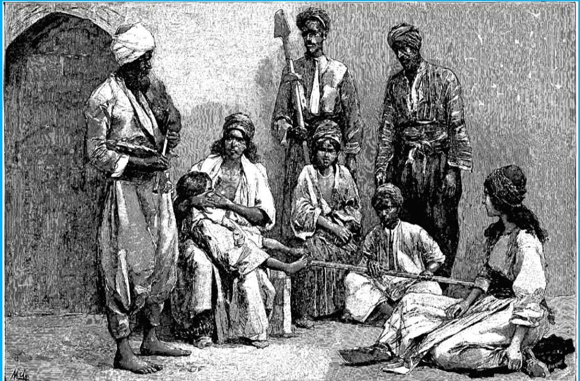
Kurdes Zazas. — Dessin de F. de Myrbach, d'après des photographies de la mission.

Kurdes Zazas - Dessin de F. de Myrbach, d'après des photographies de la mission