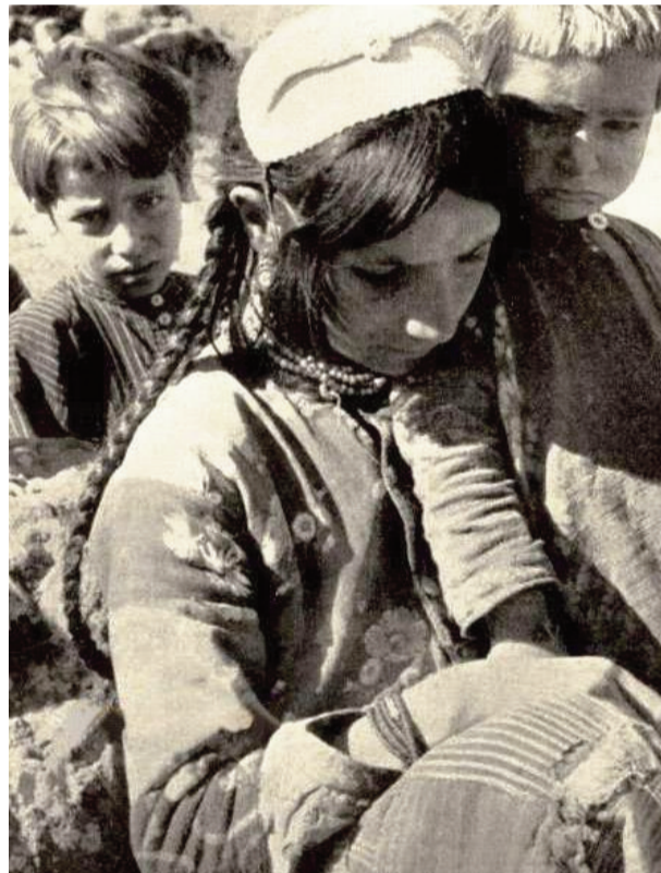
Kurdish big-sister (near Bingöl) Waka Kurde (hetê Çewlîgî)