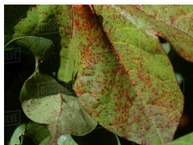
şitilhişkîya pembo alternaria solani