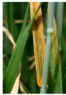
zengzerîya genim puccinia striiformis