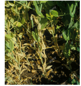
darhişkîya nîskan fusarium oxysporum