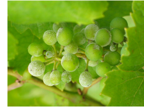
ariya (xulika) rezan uncinula necator