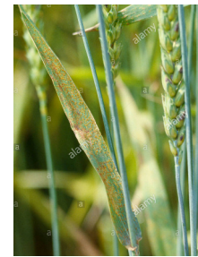
zenga (jenga) genim puccinia recondita