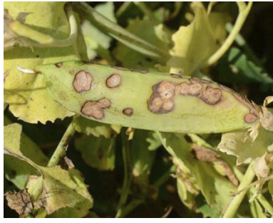
kokşewata nîskan ascochyta medicaginicola