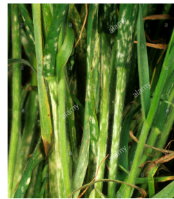
ariya (xulika / pembûloka) genim erysiphe graminis