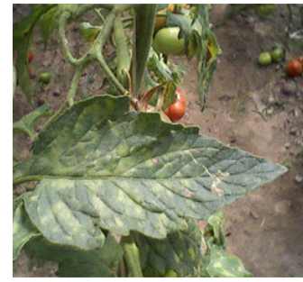
pelkufkîya pelên bacansoran (fringîyan) cladosporium fulvum