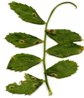
zenga (jeng) nokan uromyces ciceris-arietini