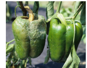
kokşewata îsotan phytophthora capsici