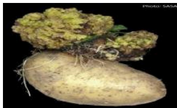
balûka kartolan synchytrium endobioticum