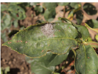
ariya (xulika) gulan podospaera pannosa var. rosae