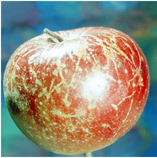
ariya (pembûloka) sêvan podospaera leucotricha