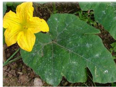
ariya (xulika) xiyargelan erysipheichoracearum