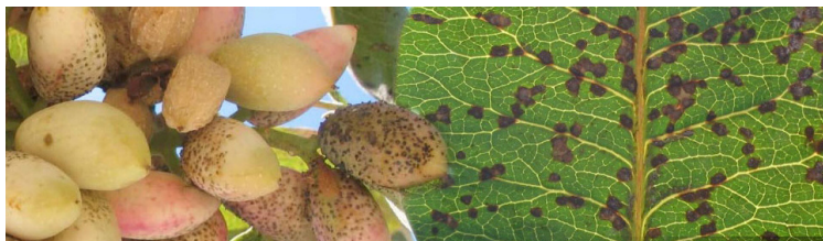
zengreşîya (jengreşîya) fistiqan pseudocercospora pistacina