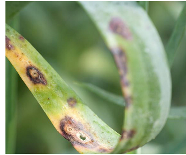
zenga (jeng) mêxikan (qurnefilan) uromyces dianthi