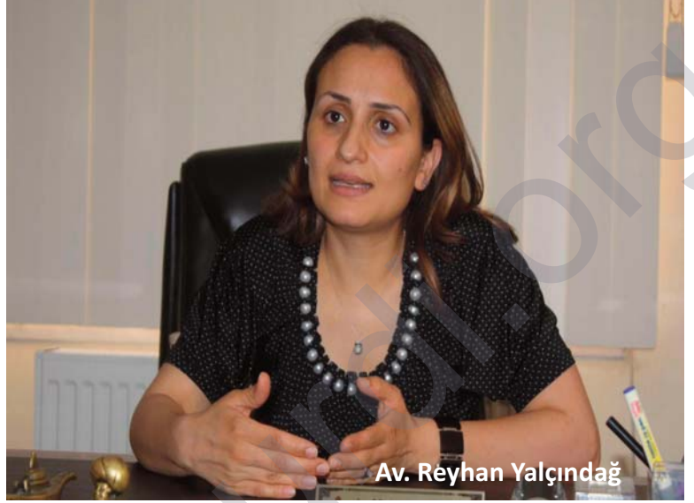
Av. Reyhan Yalçındağ