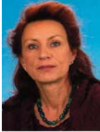
Ulla Jelpke, MdB, die LINKE