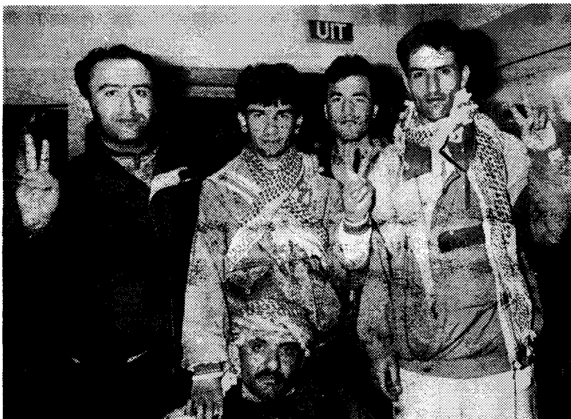
De Kurden maakten maandag in Zoetermeer het internationale V-teken.

Met hun demonstratie wilden de Kurden duidelijk maken dat er een eind moet komen aan de massamoorden en dat hun volk zeer dringend behoefte heeft aan humanitaire hulp. Met hun actie riepen zij het Nederlandse volk op om gehoor te geven aan deze noodkreet en wezen zij erop dat humanitaire hulp nodig is voor de korte termijn, maar dat de uiteindelijke oplossing echter het recht op zelfbeschikking is.