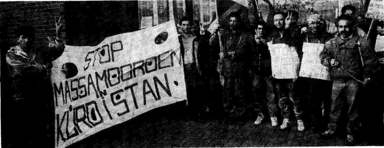
Van Arnhem via Zoetermeer liepen de Kurden een protestmars naar Den Haag.