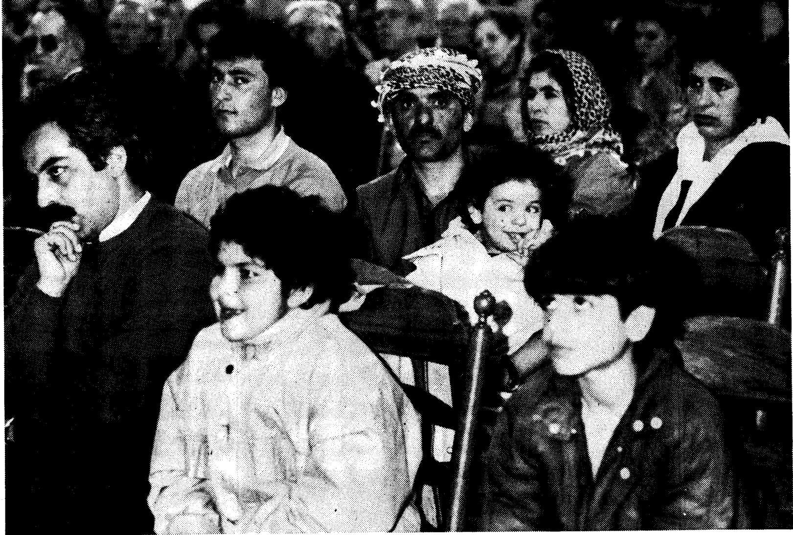
In de Walburgskerk in Arnhem sloten de Arnhemse Koerden gisteravond met een drukbezochte bijeenkomst hun vijfdaagse demonstratieve tocht door Nederland af.