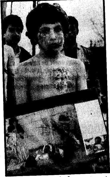
Koerdisch jongetje demonstreert. Reporter behandelt vanavond het leed van de Koerden in Irak.

Langs een spoor van vernietiging gaat de schrijver op zoek naar documenten van de geheime dienst, die werden achtergelaten in postzakken en archiefkasten toen het Iraakse leger voor de Koerden op de vlucht sloeg. Kanan Makiya vindt niet alleen nauwkeurige registraties van martelpraktijken en stapels persoonlijke eigendommen van mensen die werden vermoord. Hij vindt ook videobanden van verhoren door de geheime politie en van openbare executies, waarbij familieleden werden gedwongen te applaudiseren en toeschouwers na het vuurpeloton hun pistolen mochten leegschieten op de ontzochte lichamen. Schokkende beelden zijn het. Lu-