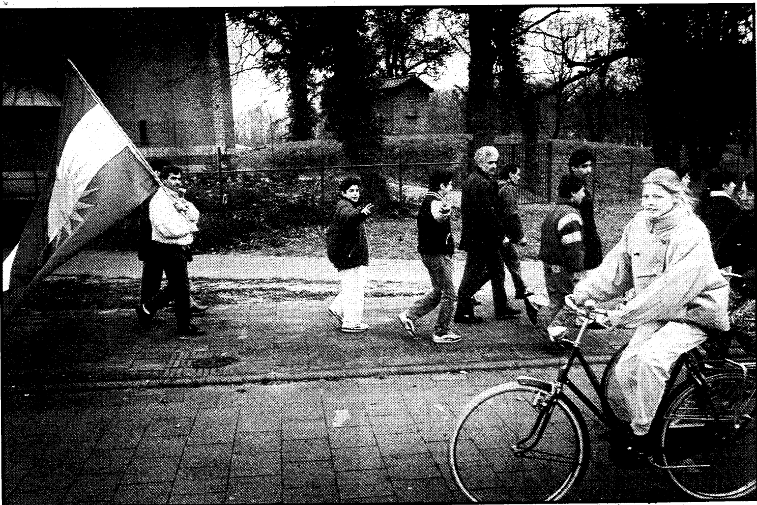
De groep Koerden in Wageningen.