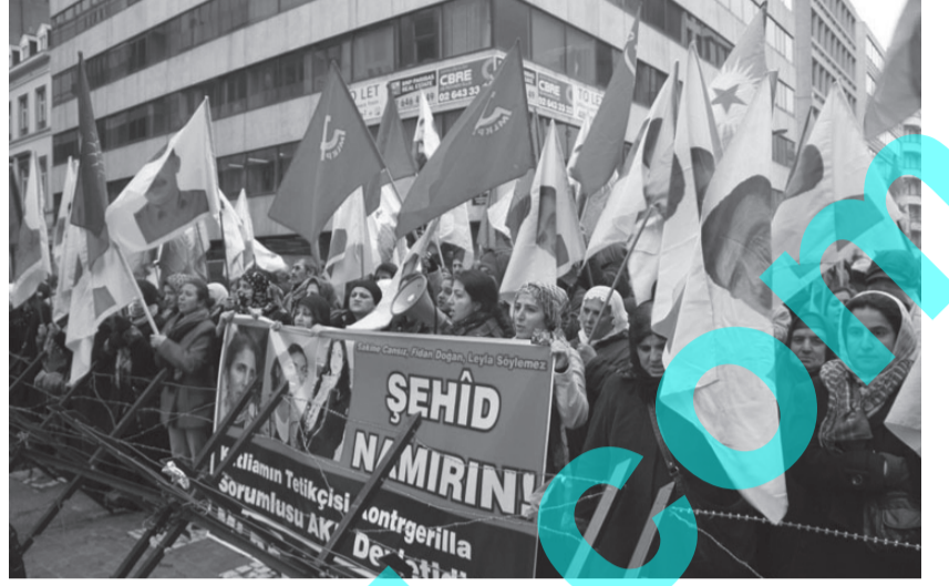
Fransa'nın başkenti Paris'te, 9 Ocak günü Kürdistan Enformasyon Merkezi'nde düzenlenen suikastla 3 Kürt kadınının katledilmesi Kuzey Kürdistan'da sokağa dökülen on binler tarafından protesto edildi.✪

Yüz bin kişinin katıldığı Paris'de düzenlenen mitingde, yürüyüş başlamadan önce çeşitli kurum ve örgütler adına konuşmalar yapıldı. Avrupa Alevi Federasyonu Başkanı Turgut Öker Aleviler olarak katliamı kınadıklarını belirtti. Öker, "Birleşmekten başka, birbirimizin acısına sahip çıkmaktan başka bir yol yok." dedi. MLKP temsilcisi de katliamın halkların sesini kısmayı hedeflediğini ancak katliamcıların başarıya ulaşamayacağını belirtti. Tamil Topluluğu adına söz alan temsilci ise kendi liderlerinin katledilişini hatırlattı, "Kürt halkı militan bir halk, herhalk gibi özgürlüğü hak ediyor" dedi. BDP Eş Başkanları Gültan Kışanak ve Selahattin Demirtaş ile DTK Eşbaşkanı Aysel Tuğluk ve milletvekili Leyla Zana da miting alanındaydı. Avrupa'daki Kürt siyasetçiler ve Kürt sivil toplum örgütlerinin temsilcileri hepsi eylemde yerlerini aldı.