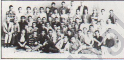
Diyarbakır zindanı 36. koğuş direnişçileri

Diyarbakır zindanlarında 2000 savaş esirinin katıldığı açık grevi eyleminin duyulması ardından yurt içi ve dışından yoğun eylemlerle destek gördü. Sömürgeci zindanlarda uyguladıkları bütün baskı ve yıldırmaya yönelik kararları, savaş esirleri kararı bir şekilde eylemlerini sürdürdüler. Direnişin etkisini kırmak için sömürgeci şekerli su bile vermediler. Bu durum insanlık dışı bir uygulama olduğunu, İnsan Hakları Derneği Ankara Şube Başkanı Muzaffer Erdost da bir açıklama ile kamuoyuna duyurdu.