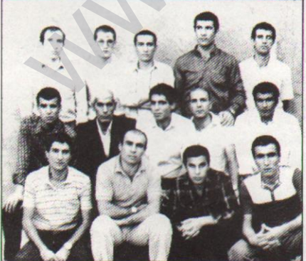
Diyarbakır zindanı 35. koğuş direnişçilerinden bir grup

önelimlere rağmen, Hilvan'da cenazeye yüzlerce Kürt yurtseveri katıldı. Şehit yoldaşın annesi, cenaze başında yaptığı konuşmada, "Gururulum" diyerek, "Hiç ölünse simdi diğer anatar oğulları ile serbestçe görüşebiliyorlar" şeklinde açıklamada bulundu.