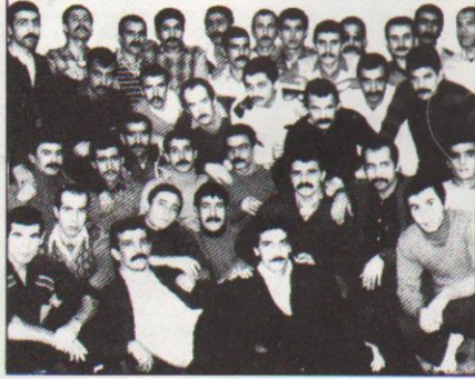
Eskişehir zindan direnişçileri toplu halde

PKK'li savaş esirleri ve Türkiye devrimcilerinin tutuklu bulunduğu