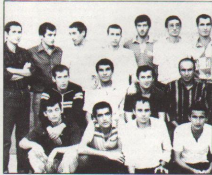
Diyarbakır zindanı 35. koğuş direnişçilerinden bir grup

"Canlar... Bugün "bayram." Bizler, bayramın sıcaklığından, halkımızın dost sofralarından ve birlecek Partimizden uzaklarda içerdediz. Sizlerden işe, yıldıç kadar uzak ama ülküklü korkutmayoruz bizi. Çünkü gerçekçiyiz, yareğiniz, bilinciniz, kavganızız yareğinize. Gerçek anlamda bir uzaklık, bir yalnızlık hiç mi hiç yaşamadık. Yaşamak ve buna ömür boyu mahkum etmek istedişler de başaramadılar. Ortak gerçekçimiz, varlığımız, kurtuluş tutkumuz, öz-bilincimiz olan Partili cesaret ve kişiliğimiz buna izin vermedi... Evet bugün "bayram!"