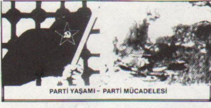
PARTİ YAŞAMI - PARTİ MÜCADELESİ

Yaşam ve ölüm... Birbirine zit ama aynı zamanda birbirinden kopmaz, birbirini bütününe iki olgudur insanlığı için. Ve her biri de kendi içinde bir gerçekliği yaşar. Bu yazıda üzerinde durmak istediğimiz yaşam ve ölüm olgularına daha çok toplumsal ve ulusal kurtuluş savaşlarının harcı olan insanların ölüme ve yaşama nasıl bakmalarına ilişkindir. Her biri de hiçbir yoruma ve söze yer bırakmayacak şekilde kendi kalemlerinden, yüreklerinden sesi olan dillerinden aktaracaktır.