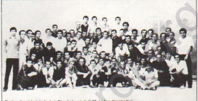
Zindan direnişlerinin oneri, Diyarbakır zindanı 35. koğuş direnişçileri