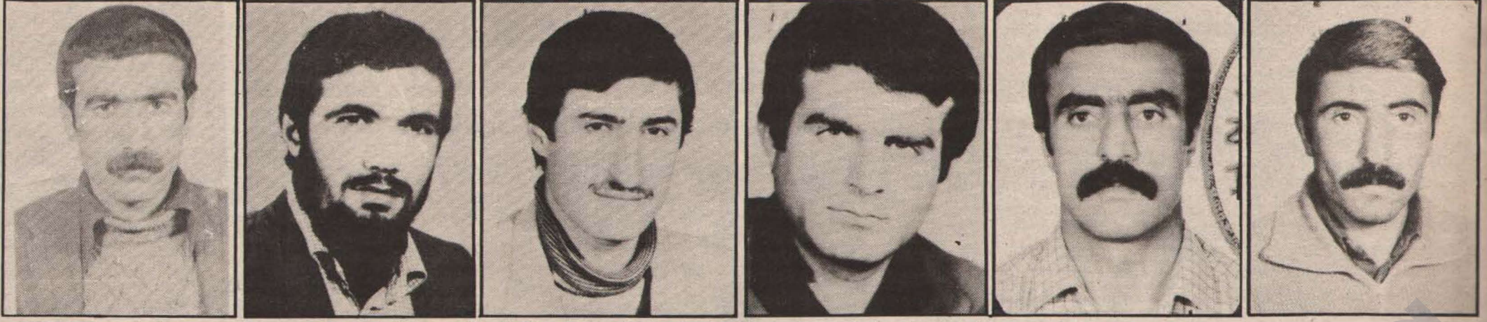
Baştarafı son sayfada