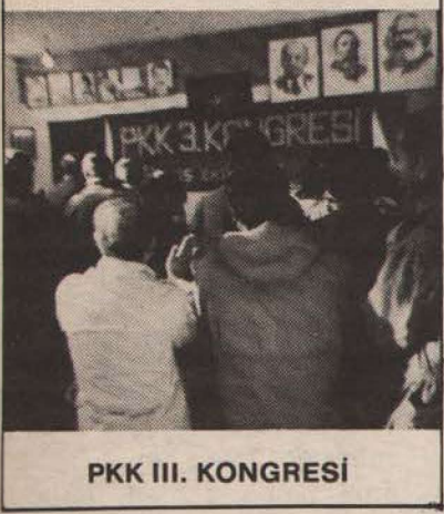
PKK III. KONGRESİ