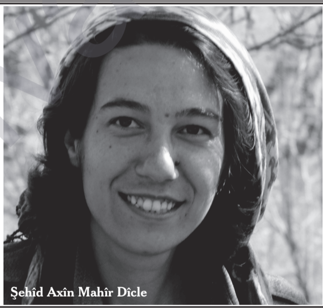
Şehid Axın Mahir Dicle