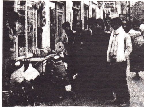
Şimdi halkımız geleceğinden daha da umutlu...

Adana'dan Kürdistan'a doğru yol almaya devam ederken, Birecik köprüsünde arabamız askerlerce durdurulup, aranmaya başlandı. Aramada üzerinde kimliği bulunmayan bir kişi tutuldu. Araba personelinin müdahale istemleri üzerine, başçavuş "kimliksiz dolandan 75 bin lira ceza almıyor. Bundan sonra kimliksiz kimsede doluşmasın" deyip bıraktı. Birden aklımda "Yol" filmindeki "Kürdis-