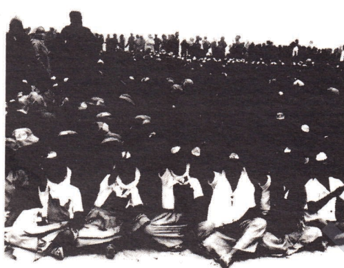
Bati Sahra halkı, genç-ihiyar, çocuk-kadın...

Usak ruhlu Kral II. Hasan da emperyalizmin aldığı destekle zor kullanarak ülkemizin bir kısmını ilhak etti. Bununla da yetinmeyerek Bati