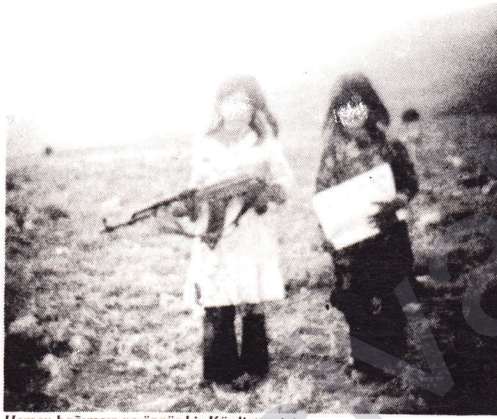
Herşey bağımsız ve özgür bir Kürdistan için.

* Ulusal Direniş Mücadelemizde Serxwebün'u Güçlü Bir Silah Haline Getirmek İçin Güçlerimizi Birleştirelim!