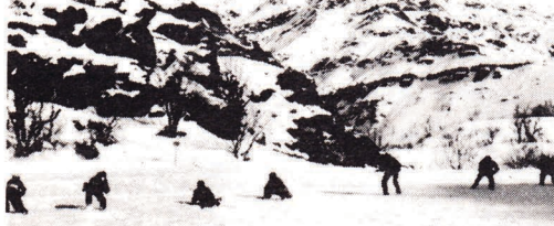
Hiçbir baskı, zulüm, katliam ve tehdit karşılıksız kalmayacaktır!

15 Ağustos direniş ve saldırı eylemleri sırasında Eruh ve Şemdinli eylemlerine katıldıkları iddiasıyla gözaltına alınan 84 yurtseverin, 21 Ocak 1985'de sömürgeci mahkemelere çıkarılarak, gelişen devrimci-direniş eylemlerinin bunların şahsında "yargılanmak" istendiği öğrenilmiştir. Büyük çoğunluğu idam ve müebbet hapis cezalarıyla "yargılanacak" olan 84 kişinin, gelişen eylemlerle hiçbir belirlenim olmasa, davamın en ilginç yanını oluşturmaktadır. O halde, askeri faşist cunta, alelacele açtığı bu dava ile nereye varmak istemekte, bu insanların şahsında yargılanmak istediği şey gerçekte ne olmaktadır.