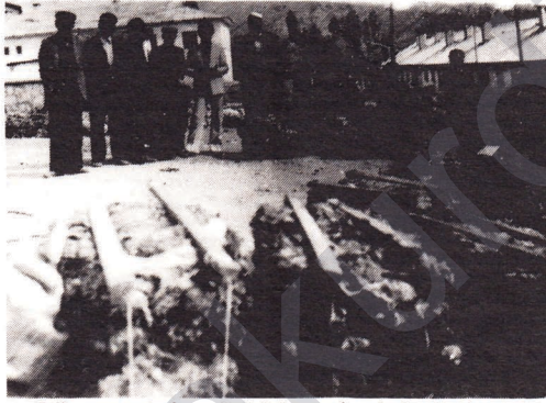
Halkımızın geçim kaynağı tütünü gaspeden sömürgeci talancılar.

da bir toplumsal değer bütünlüğü gerekiyordu. O halde olmayan değerler, talan edilerek kazanılması gerekiyordu. Ama yapılan Talan kervan soygunlarına pek benzemeyecekti. Bunu kısmen de olsa kamufle etmek zordu. Onun için sahiplerini ya katletmek gerekiyordu ya da bütün dünyanın gözlerinin içine baka baka varlığını inkar etmek gerekiyordu. Bu yok sayma uzun sürede işleri bozabilirdi. Onun için onları hıza başkalaşıma uğratmak gerekiyordu. Tabii her türlü yöntemi mübah sayarak... Bundan dolayı da cumhuriyet tarihinde Kürt halkının değerleri Türk uluslaşmasına aldıkları toplumsal değerleriyle temel harcı yapılmıştır. İşte hâlâ Kürdistan'da yapılan talan ve katliamın özünü bu anlayış teşkil ediyor.