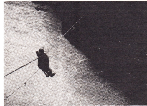
HRK savaşçıları, halkımızın özgür geleceğini teminatdır.

ve mecburen olayı, 11 yaşındaki oğlumla yükledim. Oğlumla alıp hem nüfus dairesinde yaş kontrolünü, hem de doktor muayenesinden geçirmek esas yaş tespitini öğrenmeye çalıştım. Bu işlem sonucunda oğlum, nüfus kütüğünde 4 yaşını gösteriyordu. Esas yaş ise kontrol sonucu 11 gösteriyordu. Oğlum yaşı doğru yazdırmışım diye tekniği mahkemeye verdim ve yine hakim beni azarlayıp kızarak içeri atacağını söyledi. Ben de öfkemi engelleyemeyerek çıkış yaptım ve 'istediğin kadar içeride tut, istediğin kadar ceza ver, umurumda değil,