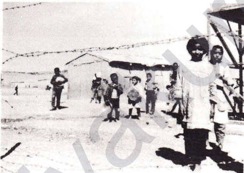
Siyonist esir kamplarında geleceklere umutla bakan Filistin çocukları.

abilir: 1980'in Ekim'inde Irak-İran'a saldırtmış (bugün bir körfez savaşına dönüştürülmek istenmekte), 12 Eylül 1980'de faşist cunta işbaşına getirilmiş, Pakistan faşist yönetimine ve Afganlı gerillere açtık destek verilerik Afganistan devrimine müdahale edilmeye çalışılmış, ilericiler yönetimler karşı darbe girişiminde bulunmuş (Suriye, Libya), ABD Libya'ya açtık sataşarak bu yönetimi devirmek istemiş, 1982'nin Haziran'ında en güvenilir maşası İsrail siyonizmi eliyle Filistin devrimini tasfiye etmek, Lübnan'da faşist bir yönetimi işbaşına oturtmak, Suriye'yi çökertmek için saldırdı bulunmuş, İsrail Lübnan'a zor gücüyle 17 Mayıs antlaşmasını imzalatmıştır. Emperyalizm, öden vermezsin, saldırgan bir tutum izlemekte, uygulamaları tüm bu girişimleriyle 1960'ta sağladığı ve günümüzde aleyhine bozulan dengesi eskisinden daha sağlam ve halklara kan kusturan faşist rejimleri iktidara getirecek lehine çevirmek istemektedir. Böylesi koşullarda, yemzelliği artık tartışma götürmez bir biçimde yakın pratikte de görüldüğü gibi sınımdan açığı çıkmış mevcut önderliklerle, emperyalizmi geriletip darbe vurmak mümkün olmamaktadır.