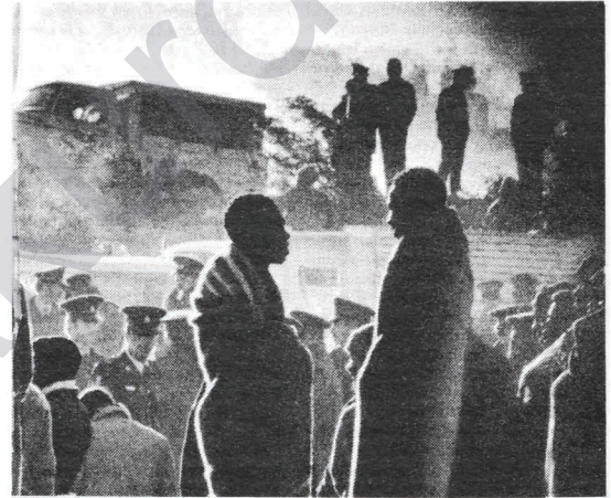
Hiçbir baskı ve saldırı mücadeleyi durduramaz.

Halksız MPLA öncülüğünde Portekiz sömürgecilerine karşı yürütülen ulusal kurtuluş savaşı, bu kez de G. Afrika ırkcılarına karşı gösterilmek durumundadır.