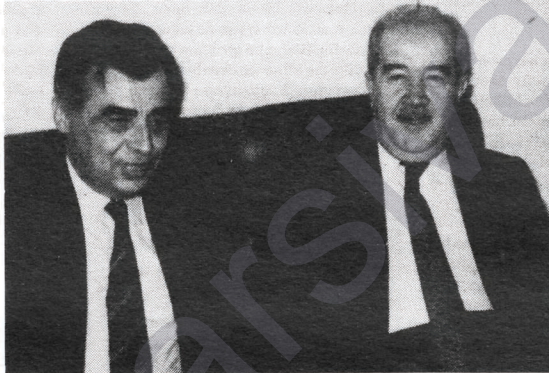
SODEP ve DY'nin peşinde?

Turgut Özal Hükümeti, gerek yaşanan sürecin özellikleri ve gerekse bu yönetimin kısaca sözünü ettiğimiz özgül karakterinden ötürü, genel olarak bir geçiş hükümeti olarak değerlendirilmektedir. Bu bir anlamda doğrudur.