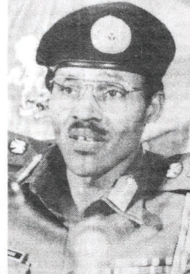
General Muhammed BUHARİ