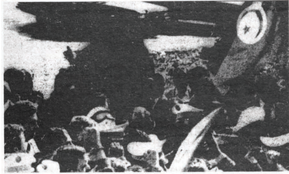
Kazanılan ayaklanan halk oldu.

Yönetimin protestolar karşısında geri adım atarak, zam kararını kaldırması bir gerçeğe bir kez daha parmak basma fırsatını doğurdu. Eğer kitleler örgütlenmiş ve eyleme kaldırılabilmişse, bunun karşısında ne kadar güçlü olursa olsun hiçbir güç duramaz. Görüldüğü gibi, kısa süreli