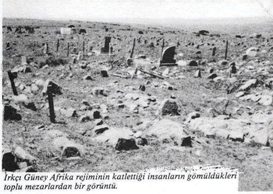
Irkcı Güney Afrika rejiminin katlettiği insanların gömüldükleri toplu mezarlardan bir görüntü.

Portekiz sömürgecilerinin yenilgiye uğratılması ile bağımsızlığa kavuşan Angola halkı, sürekli bir biçimde emperyalistlerin ve yerli usakların saldırı ve provakasyonlarıyla karşı karşıya gelmektedir. Daha ulusal kurtuluşun sıcak alevleri içerisinde başlatılan bu saldırılar, halk cumhuriyetinin kurulmasıyla arttırılarak, çok yönlü bir şekilde geliştirilmektedir.