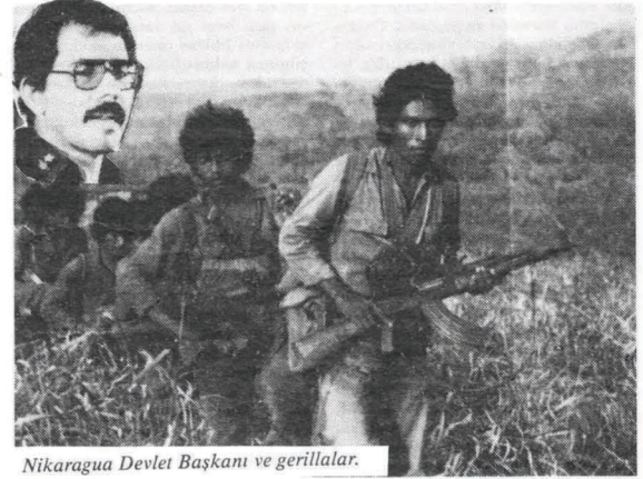
Nikaragua Devlet Başkanı ve gerillalar.

kendisi açısından elverişli gördüğü bu dönemde amaçlarına, bu birlikler aracılığıyla ulaşmaya çalışmaktadırlar. Latin Amerika'da da yeni bir Vietnam'a karşılaşma gücünü kendisinde bulamayan ABD, bu aşamada işlerini bu şekilde sürdürmek istemektedir.