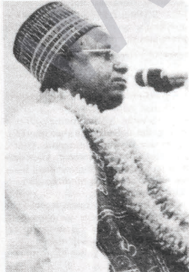
Eski Devlet Başkanı Şehu ŞAGARİ

ABD'nin hiçbir tehdit ve saldırısının yitirdiği ve haklı yoldan vazgeçemediği Nikaragua halkı, bu türden saldırılar karşısında hiç mi hiç geri adım atmayacaktır. Zaten saldırı karşısında hazırlıklı olan Nikaragua halkı, ABD'ye ve yerli usaklarına hakettikleri dersi verecek ve bir kez daha onların iştahlarını gırtlığında bırakacaktır. ★