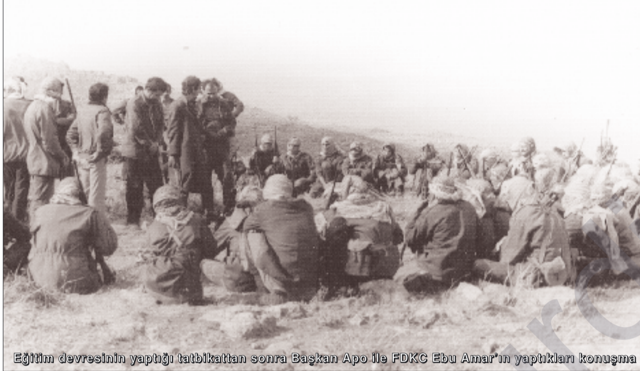
Eğitim devresinin yaptığı tatbikattan sonra Başkan Apo ile FDKC Ebu Amar'ın yaptıkları konuşma

Bu iki akımın çeşitli versiyonları, çeşitli biçimleri olacaktır. Biz ayırım yapmadık