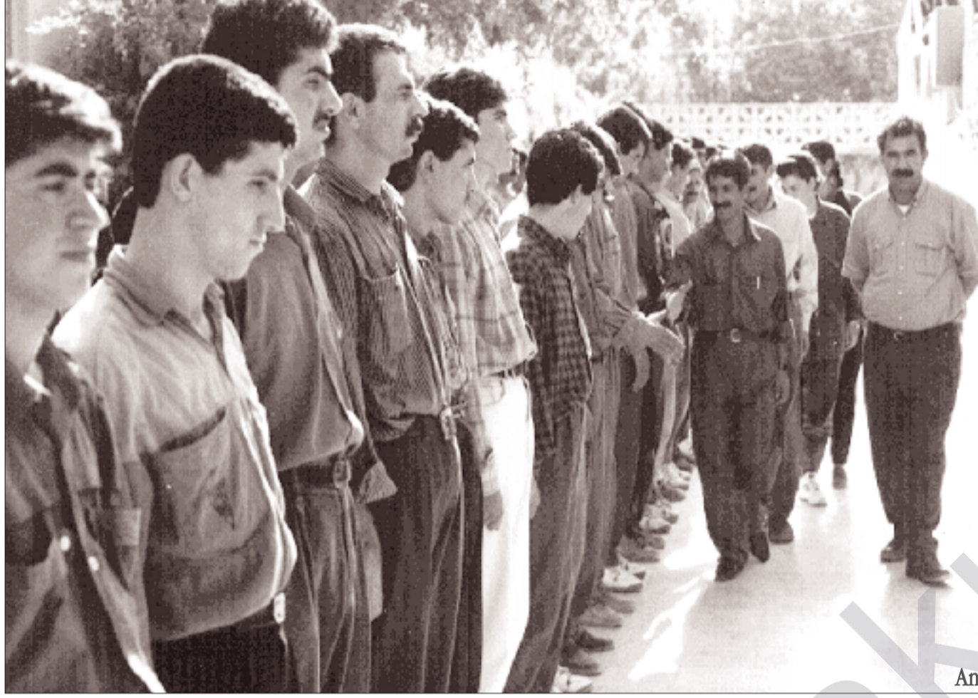
Amed Eyaleti Koordinatörü Nasır yoldaşla yaptığımız röportaj