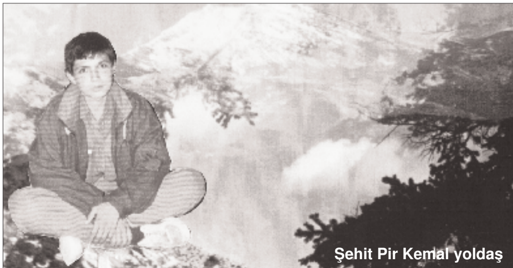
Şehit Pir Kemal yoldaş