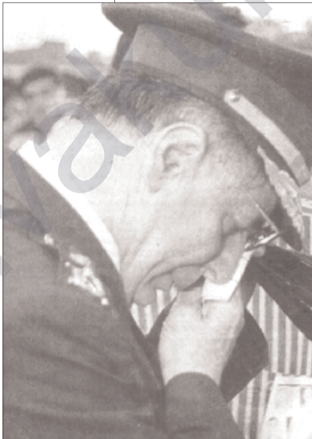
Savaşın 13. yılında sömürgeci generaller aılıyor

pon bölgesinden bahsediliyor. Türkiye, bu işi kendi başına kontrol edemeyeceği görüşünü BM'ye kadar götürdü; 'ben kendi başıma bu işi kontrol edemem' dedi. BM'nin -ki, ABD önderliğindedir-, kesinlikle devreye girmesi gerektiği savunuldu. Bütün dünya yardıma çağırılıyor. Hududun her iki tarafında çadırlı kentler kuruluyor. Daha da ileri bir adım olarak BM'nin himayesinde ve hatta BM gücünün denetiminde bir Kürt bölgesi yaratılmak isteniyor. ABD, buna şimdiden yüksek ilgi gösteriyor. Yarın ise, diğer emperyalist devletler peşisıra ilgi gösterir. Bu ikinci İsrail deneyi midir demeyeceğim; çünkü, İsrail deneyimi bu temelde oluşmamıştır. Filistin toprakları üzerinde Yahudi yerleşimi ile başlamıştı. Bizim böyle bir durumumuz yoktur. Kürdistan'da gerici aşiretçi-feodal güçlerden bir tampon bölge oluşturulmak isteniyor. Bununla hedeflenen birinci amaç, Kürdistan'ın kapsamlı ulusal kurtuluş devrimini frenlemektir. Bu, Türkiye'nin amacıdır. İkincisi ise, emperyalizmin Irak üzerindeki emellerini sürdürmeye yöneliktir. Özellikle İsrail'in de amacı olan, Kürdistan üzerinden genelde Arapları, özeld-