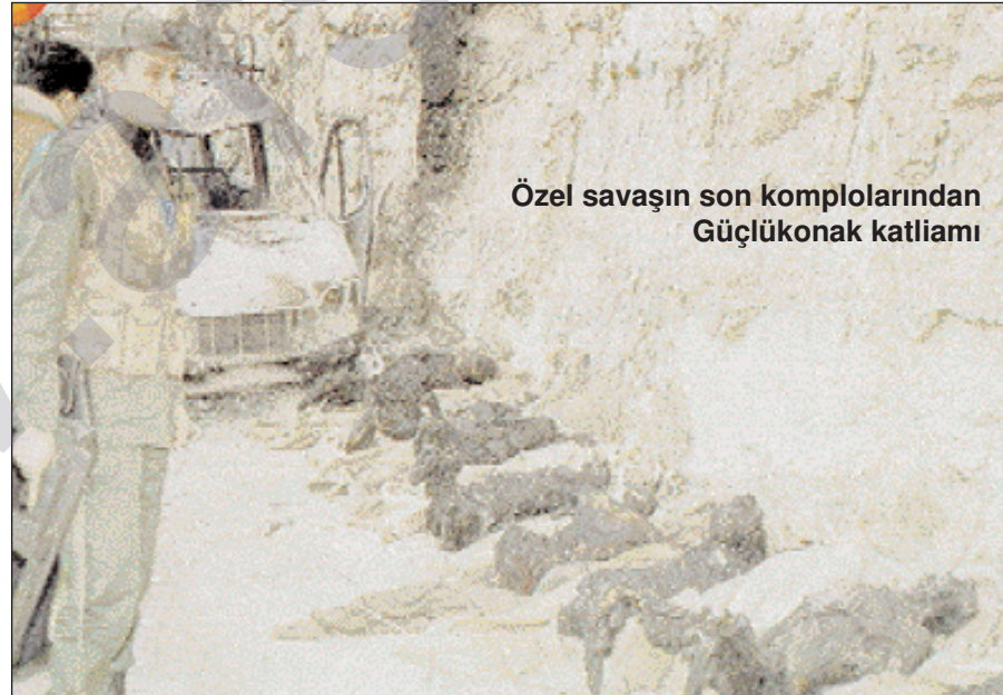
Özel savaşın son komplolarından Güçlökönak katliamı

Özel savaş rejiminin önemli bir oyunu da şudur; kendisi en vahşi bir komplo ve terör gücü olmasına rağmen “uluslararası terörizm” den söz etmesi ve bu konuda bir “tezi” olduğu ile övünerek kendisini maskeleye çalışmasıdır. Olay şöyle