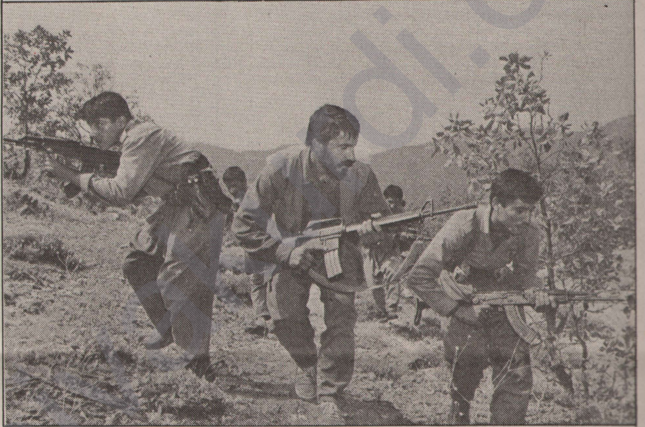
PKK Zindan Direniş Konferansı belgelerinden özeleştiriler...

"Bu komple saldırıda yenilmemenin, ayakta durmanın tek yolu devrimi kişilikte en ihtilalcı biçimde yaşamaktır"