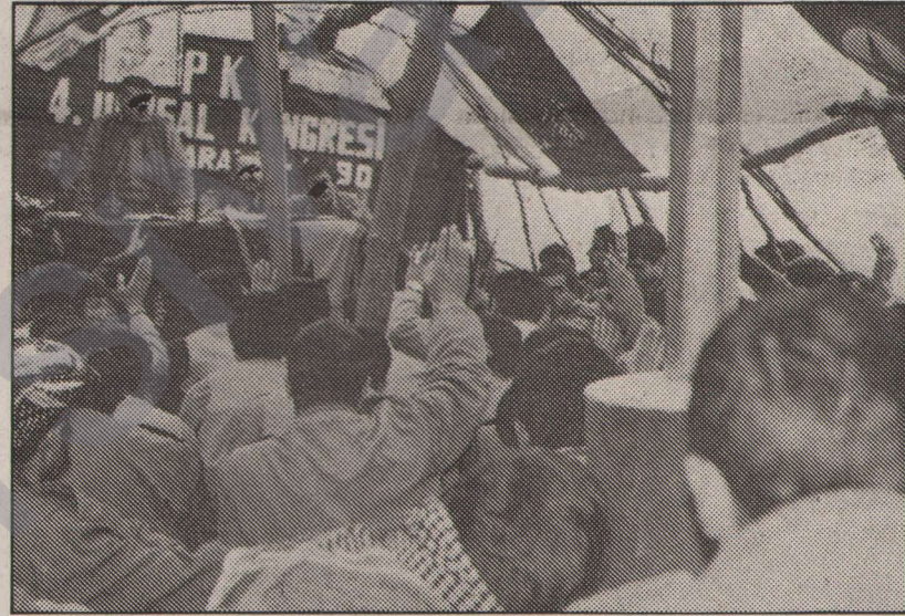
PKK IV. Ulusal Kongresinden...

Önemli bir evrede gerçekleşen partimizin III. Kongresi, gerçekleştiği dönem, bu dönemde ulusal kurtuluş savaşımızı tıkayan, geliştirip güçlendirmeyen çeşitli anlayışların giderilmesi, düşmanın tasfiye çabalarının, her türlü gerici zorunu kullanarak geliştirmek istediği imha sürecinin boşa çıkarılması anlamında tarihsel öneme sahiptir. Herşeyden önce sömürgeci Türk devleti, mücadelemizi bastırmak ve adım adım imhaya sürüklemek için yasal kılıflarla birçok tedbire yönelmekteydi.