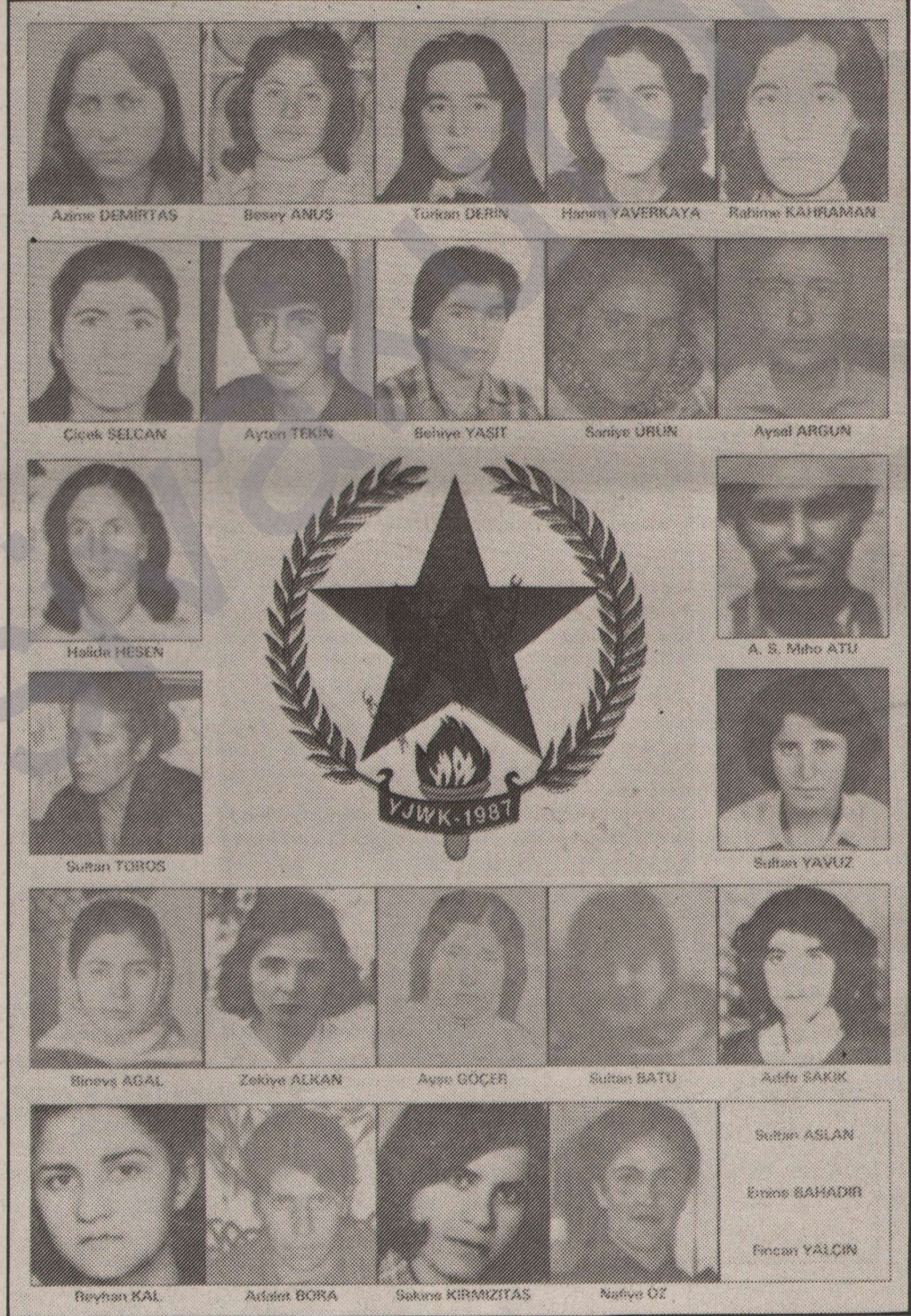
Direniş anınız özgürlüğe giden yolda sönmeyecek bir meşaledir...

düğü dönemin faaliyetlerine denk düşüyor. Başka bir deyişle, devrimci teorik-ideolojik üretim faaliyetlerinin kendisi oluyor, esas olarak bizdeki aydınlanma hareketi.