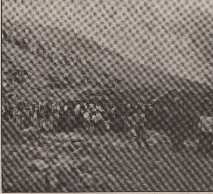
Gerillaların zozanlarda gerçekleştirdiği toplantıya katılan halk...

savaşın gelişmesi için, cephesel gelişme yaşamsal bir zorunluluktur.