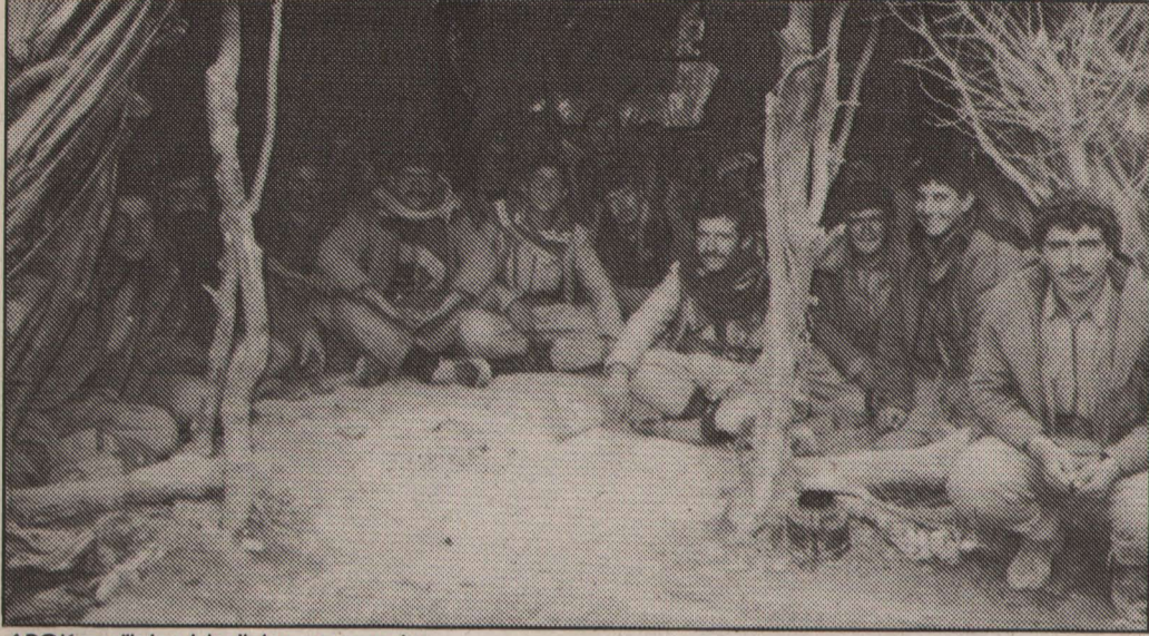
ARGK gerillaların bir dinlenme anında...

plana çıkarılması, bazılarının etkisizleştirilmesi ve bazılarının da düşürülmesi burada izahını bulur. Kör Cemal ilk ayarlamalarını bu kurum içerisinde yaparak kendisini partiye dayatmıştır. Kör Cemal pratiğine bakıldığında merkezleşmenin adımlarının atılması gerekirken tam tersine bunun tasfiyesinin adımlarının atıldığı görülecektir. Temelleri bu süreçte atılan veya kaynağını buradan alan işbirlikçi-feodal çetecilik sonraki faaliyetlerde giderek kendisini bir bütün olarak dayatmıştır.