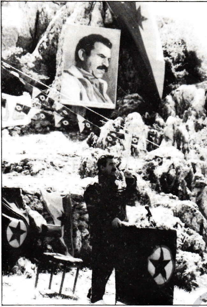
“Günümüz insanlığının oluşumunda oldukça büyük pay sahibi olan Ortadoğu halklarının gerçekliğinde bu kadar düşürülmüşlük hakim olduğu kadar, bu halkların gerçekliğinde büyük bir devrimci mücadelenin ışıkmaları da doğru bir beklenti ve de gerçekler...”

Yaşanan bu gerçekler nedeniyle Ortadoğu halkları; hiç de tarihinle yarışmayan bir şekilde, yakın çağlar tarihinde halklara oldukça ilerleme