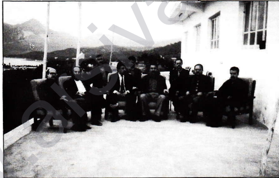
DBP 4. toplantısında yer alan örgütlerin genel sekreter ve temsilcileri...

Toplantıda, Glasnost ve Perestroika'nın yürürlüğe konulmasıyla birlikte, Sovyetler Birliği ve Doğu Bloku ülkelerinde başgösteren gelişmeler dizisinin niteliği ve bunun Türkiye ve Kürdistan devrimci hareketinde yol açtığı etkiler ve çıkarılması gereken dersler konusunda kapsamlı değerlendirmeler yapıldı. Dünya siyasal arenasında göz-