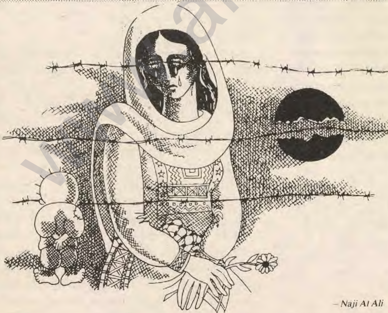
- Naji Al Ali

Şimdi içinde bulunulan zaman bizim için en kötü zamandır. Bütün kapılar kapalı vakit geçirmeksizin problemleri çözmeliyiz.