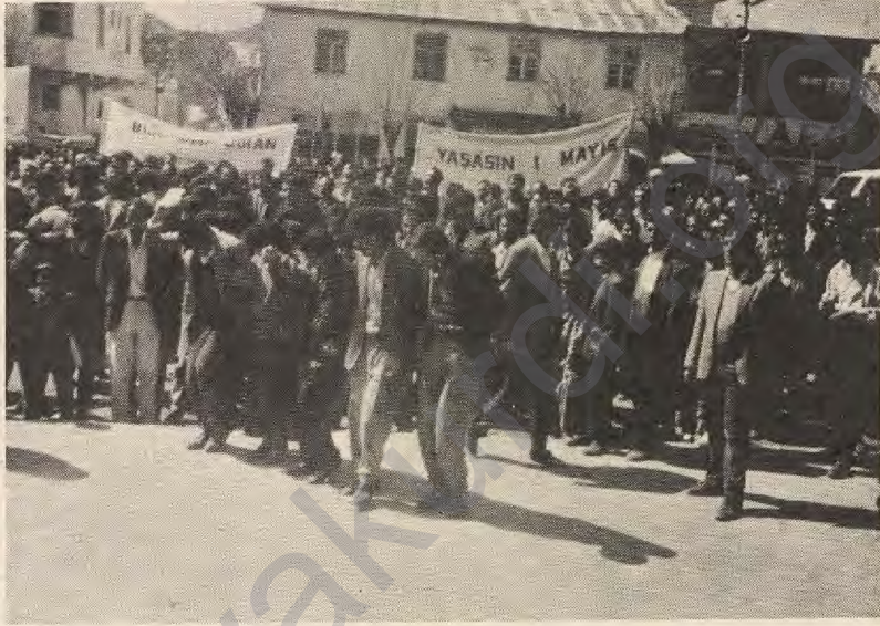
Dersim'de 1 Mayıs Mitingi

olarak Kürdistan proletaryası açısından 1 Mayısın anlamı vurgulandı. Mesajda "1 Mayıs Kürt proletaryası için mücadele ve direniş sembolüdür. 1 Mayıs Kürdistan'daki katliamlara, soykırımlara, sokak infazlarına, kontr-gerilla eylemlerine karşı kavga günüdür" denildi. SERKETİN, DERSİM Muhabiri