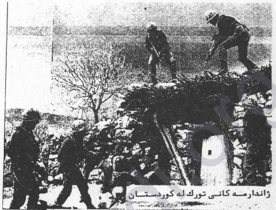
ژاندارمه کانی تورک له کوردستان

پهيمانی "ناتو" له ناوچه ئالوژو و گرنګه جيهان دا وه ئهستوی خووی کرتووه . بيجګهلهوه، وادياره تورکيا هيتا له کيس چوونی مهلبندی کهرکوک و موسلی، پاش تیکچوونی حکومتی عوسمانی باش بو هزم نه-کراوه . پيداويستی زيدهی سوتسه منيش برينه کونهکانی تورکيا دهرژ-پينتهوه . هيندی دنگ و باس رادهګهيه-نن که لهو بارهوه که لاله دیګهش خريکن يارمتهی بهو جم وچوله بدن . گوڤاری ئينګلیزی "نيوسترامن" ده-نووسی : ئەمريکا ئامادهيه له جياتی به کار هيتانی "هیزی خهشيمز" له ناوچه ئالوژدها ، له بارهی ستراتیژی-يهوه گیانی "توله ههستاندنهوه" و مهيدانی کرده وهی پتر بدابه تورکيا . ئوژال سهرهک وهزیری تورکيا ، له بهر