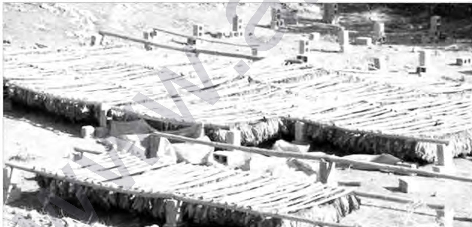
Titûna Licê çend serranê bêro di dê bibo markayê. Qabê ney zî lazimo ke rayberdoxî ney binivê û di ney çarçevoyî de verê koperatifey di gama berzê kî, demê daha kilmî di wa bibo marka. Kooperatifibişê dê paştî bido erdanê ze Licok, Helhel û dewanê dormeyê înan û dewanê ke karê înan se Licê di titûnê daha geş bibo.

Eger bêro di hal wina bibo se titûna Licê dê dinyayî di bi name bibo û bibo markayê dê herî weş.