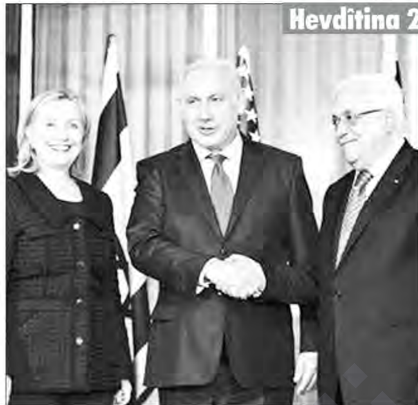
Hevdîtina 2'yem ji bi dawî bû

Montell xwest ku herêma wek herêmeke hatiye dagirkirin bê dîtin ku Israîl bi serbestî li ser xaka Filistinê nikaribe bikeve nav hewldanên keyfî.