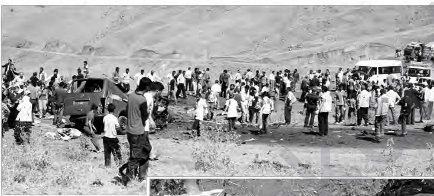
Wan ji wir bigirin' hate bihîstin.

Piştî teqîna mayîna li Peyanîsê di bin mînbûsa gundiyan de di navbera leşkerên qereqol û gundiyan de şer qewimî. Gundiyan 100 metreyan nêzî cihê bûyerê çanteyekê ku mayînen anti-tang ên TSK'ê û guleyên hawanê tê de bûn dît û dest danin ser çanteyê. Dozger çû cihê bûyerê û alozî didome. Li bajarokê Peyanîsê yê Colemêrgê duh serê sibehê bombe di bin mînbûsa gule teqîya û 10 gundiyan ku zarok jî di nav de hebûn jiyana xwe ji dest dan 2 gundi jî bi giranî birîndar bûn. Piştî bûyerê li nêzî cihê teqînê çanteyekê leşkerî ya aîdê TSK'ê hate dîtin û di nava çanteyê de 2 mayînen anti-tang ji aliyê fabriqeya MKE ya TSK'ê ve hatine çêkirin, guleyên hawanê û kablo û kamera derketin.