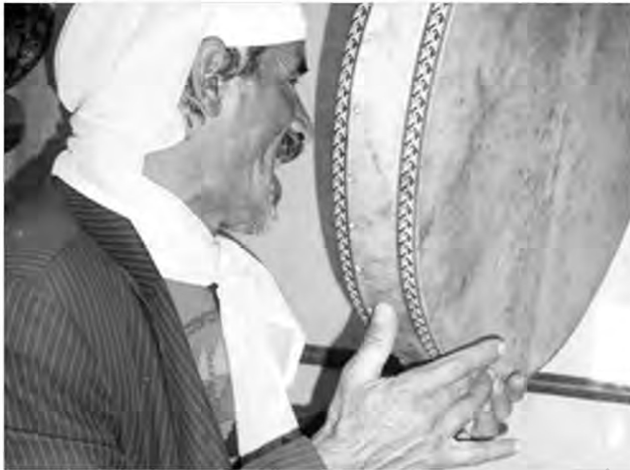
pišta wî bû...

Kî ye ev zilam, ji ku hat, kê bangî wî kir, nasê kê ye? Kes nezane û neqetkê... Lê ji bilî min kes rewşê ho venade. Wekî ku her kes hînî vî rewşê ye, ji ber ku tu tiştê xerîb tu-nebû li gor kesî... Diyar bû ku nasnameya wî erbaneya li